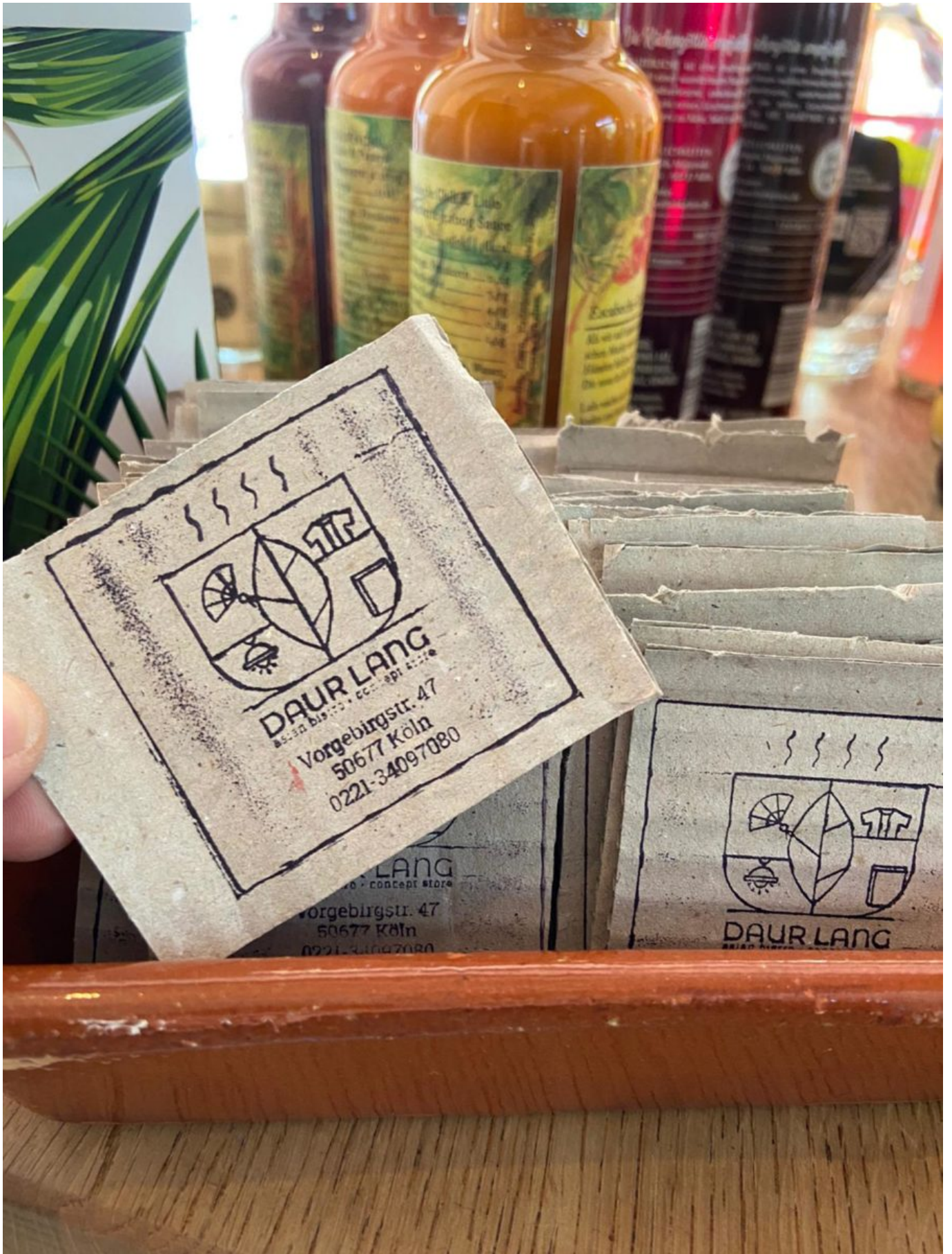
Die Visitenkarte des Daur Lang aus recycelter Pappe.

Habt ihr das Gefühl, das Menschen aus Südostasien mittlerweile besser repräsentiert in