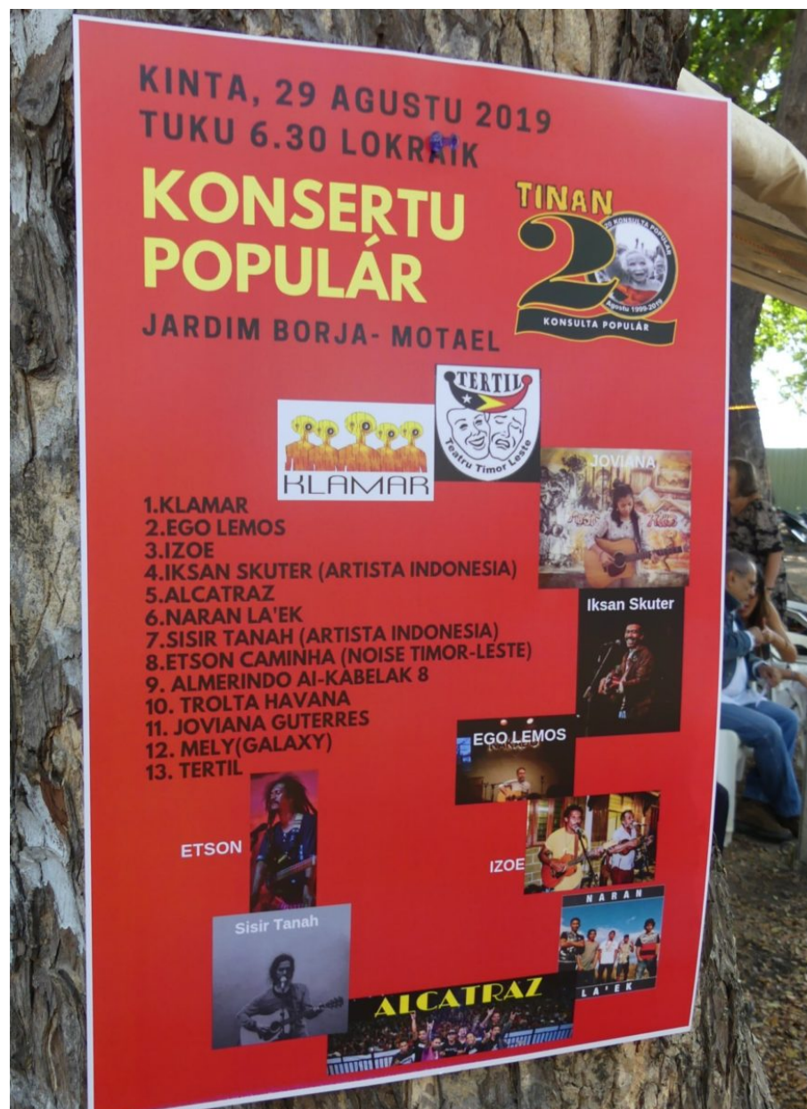
Programm des Konsertu Populár beim Solidarity Festival in Dili

Song dann bei der Buchveröffentlichung vorgetragen. Viele Inspiration und Impulse bekomme ich aus meiner Arbeit. Ich beobachte einfach das Leben, die Menschen, die Situationen. Ich brauche diese nur zu beschreiben, ich muss nichts erfinden. Meine Lieder haben alle einen Bezug zur Menschenrechtsarbeit. Momentan schreibe ich an einem Song zum Gedenken an das Marabia-Massaker ( Marabia Community Exhibition ), das sich am 10. Juni 1980 zutrug. Wieder erzähle ich die Geschichte aus der Sicht der Überlebenden, samt ihrer Klagen und ihrer Trauer. Musik hat eine starke Rolle während des Widerstandes gespielt und das tut sie auch heute noch.