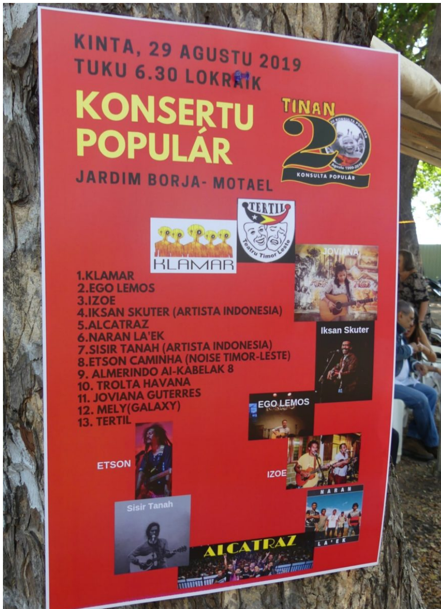
Programm des Konsertu Populár beim Solidarity Festival in Dili

Song dann bei der Buchveröffentlichung vorgetragen. Viele Inspiration und Impulse bekomme ich aus meiner Arbeit. Ich beobachte einfach das Leben, die Menschen, die Situationen. Ich brauche diese nur zu beschreiben, ich muss nichts erfinden. Meine Lieder haben alle einen Bezug zur Menschenrechtsarbeit. Momentan schreibe ich an einem Song zum Gedenken an das Marabia-Massaker ( Marabia Community Exhibition ), das sich am 10. Juni 1980 zutrug. Wieder erzähle ich die Geschichte aus der Sicht der Überlebenden, samt ihrer Klagen und ihrer Trauer. Musik hat eine starke Rolle während des Widerstandes gespielt und das tut sie auch heute noch.