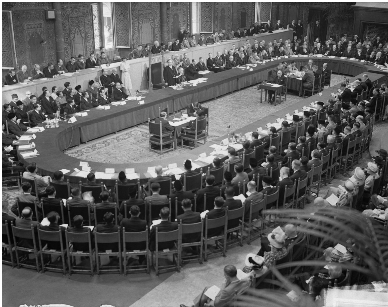
Runder Tisch Konferenz zwischen Indonesien und den Niederlanden in Den Haag, August 1949.

Die Archive von NEFIS und CMI wurden jedoch vor der Unterzeichnung des Abkommens zur Übertragung der Souveränität am 27. Dezember 1949 per Schiff in die Niederlande transportiert. Danach wurden sie viele Male zwischen verschiedenen niederländischen Ministerien hin und her verlegt und vor der Öffentlichkeit geheim gehalten. Diese Archive wurden schließlich im Nationalarchiv untergebracht und 1990 zum Teil der Öffentlichkeit zugänglich gemacht. Hier wurden sie als inbeslaggenomen, gevonden en buitgemaakte (beschlagnahmt, gefunden und gestohlen) bezeichnet und unter einem größeren Inventar von NEFIS/CMI Archive abgelegt (Zugangsnummer 2.10.62). Die gesamten NEFIS/CMI-Archive bestehen aus 75 Metern Akten und sind in 7334 Inventarnummern geordnet, während die versteckten Archive aus 3099 Akten bestehen.