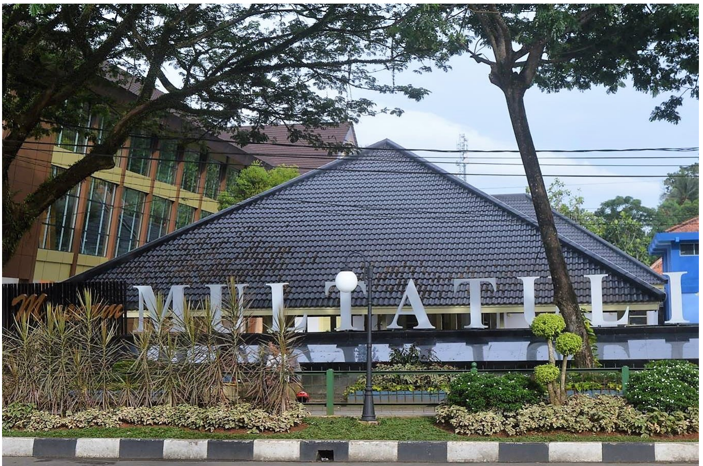
Außenansicht des Museum Multatuli

Es ist kein Zufall, dass sich das Museum so stark auf Multatuli bezieht. Er verfasste Max Havelaar , seine einflussreichstes Buch, um die Ausbeutung durch die Kolonialverwaltung in Niederländisch-Ostindien aufzudecken. Um Gewinne zu erzielen, beuteten die Niederländer natürliche und menschliche Ressourcen aus und zwangen lokale Bauern, kommerziell rentable Pflanzen wie Zucker und Kaffee anstelle von Grundnahrungsmitteln wie Reis anzubauen. Scharfe und oft unrealistische Quotenregelungen wurden auferlegt, was zu Unterernährung und Hungersnöten der lokalen Bevölkerung sowie zu einer großen Ungleichheit zwischen Beamte*innen und Bäuer*innen führte. Douwes Dekker wählte das Pseudonym Multatuli – was auf Latein „Ich habe viel gelitten“ bedeutet – als Beschreibung der Ungerechtigkeiten, die er beobachtete.