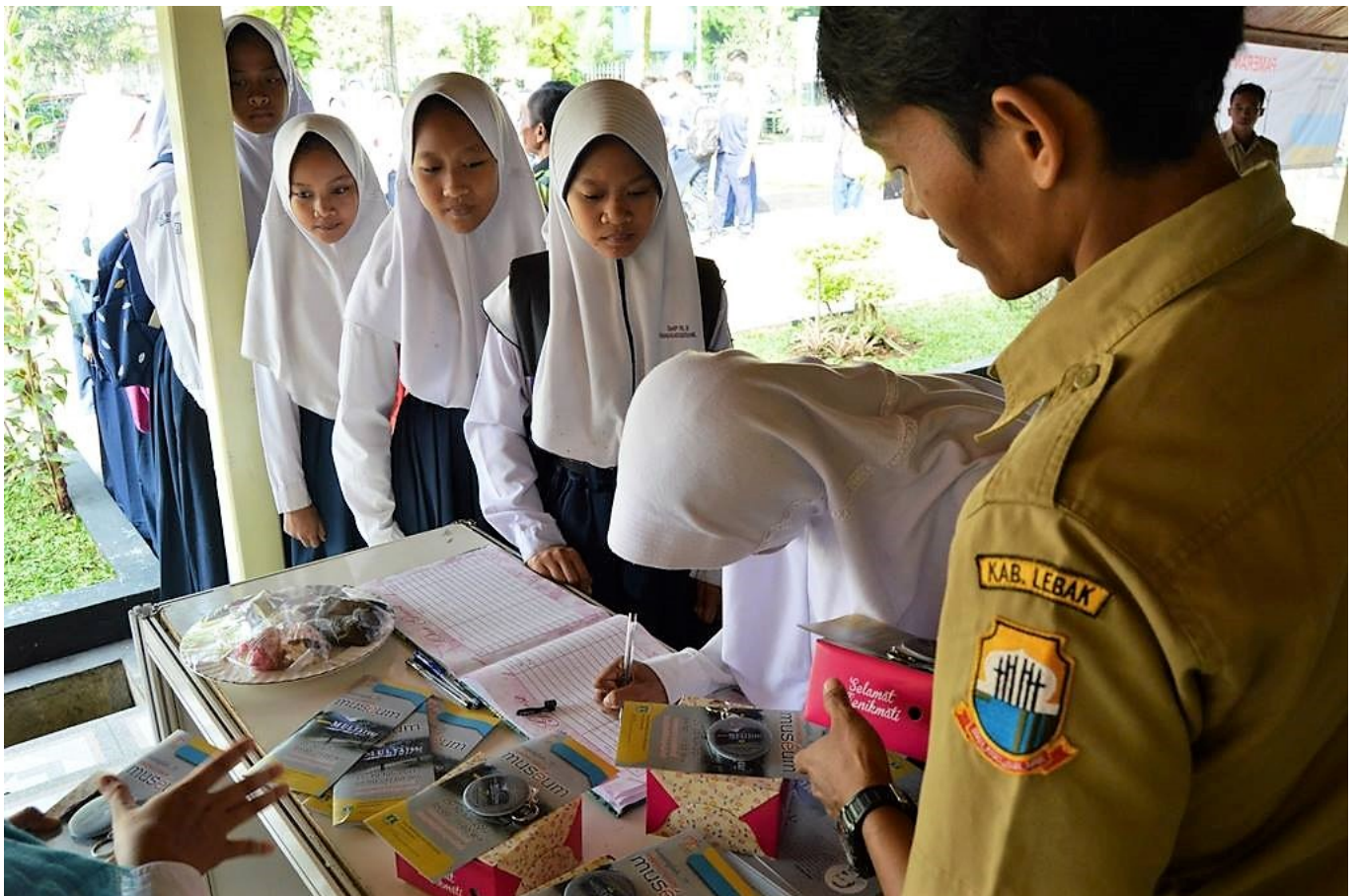
Besuch einer Schüler*innengruppe im Museum Multatuli

Alte Vorstellungen von weißer Überlegenheit, ‚West gegen Ost‘ und ‚Kolonisator*innen gegen Kolonisierte‘ auszuleuchten, ist kein leichtes Unterfangen. „Koloniale Nachwirkungen sind ein Thema mit sehr großer Bandbreite. Es geht darum, die weiße Vormachtstellung zu kritisieren, die die diskriminierende Politik der niederländischen Ostindien-Ära hinterlassen hat, aber nicht nur darum“, sagte die indonesische Forscherin Eunike G. Setiadarma und fügte hinzu, dass auch die rassistische Diskriminierung zwischen lokalen Ethnien in Indonesien auf die Politik und Denkweise zurückgeführt werden kann, die während der Kolonialzeit ‚eingepft‘ wurden.