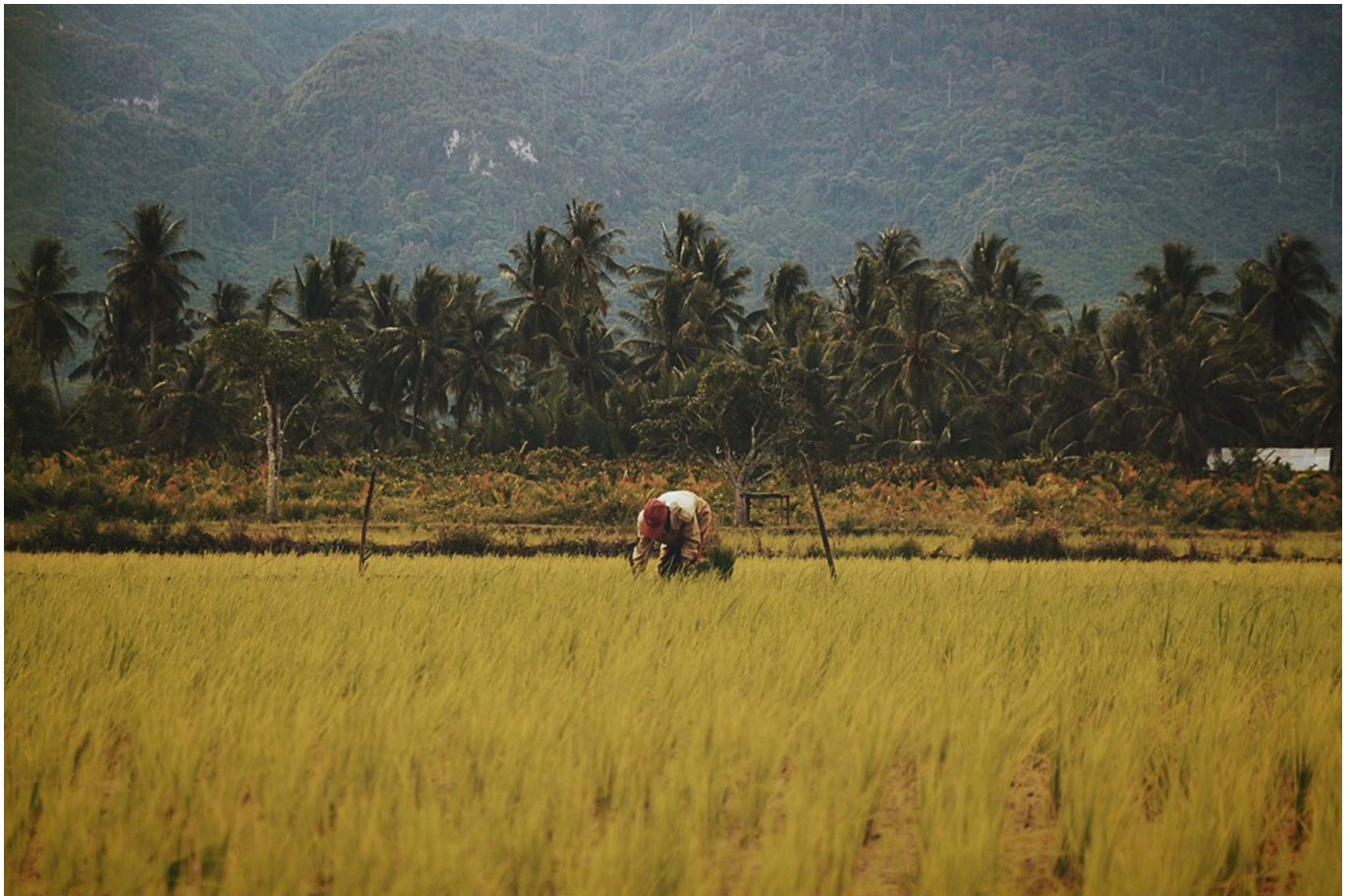
Reisfeld im Karstgebiet in Sangkulirang Mangkalihat, Ost-Kutai Distrikt, Ost-Kalimantan

Der Fluss ist Zeuge des Aufstiegs und Falls des Hindu-Reiches Kutai (350 – 400) und des Sultanats Kutai Kartanegara (1300 – 1945). Er ist seit 1565 Handelsweg und Verbreitungsweg des Islam in Ostkalimantan. Die Beziehung der Menschen zum Fluss wird jedes Jahr mit dem Erau-Fest gefeiert, bei dem sich die Menschen für die Gaben der Natur bedanken. Es wird seit dem 12. Jahrhundert gefeiert und mit dem Belimbur-Ritual beendet, für das sich die Menschen im Fluss rituell reinigen. Samarinda, am Delta des Flusses, ist seit dem 18. Jahrhundert Handelshafen und wurde 1959 Provinzhauptstadt. Die Stadt hat immer wieder Menschen angezogen, die auf der Suche nach einem besseren Leben waren. 2019 zählte die Stadt 858.080 Einwohner, was 23,5 Prozent der Einwohnerzahl der gesamten Provinz entspricht.