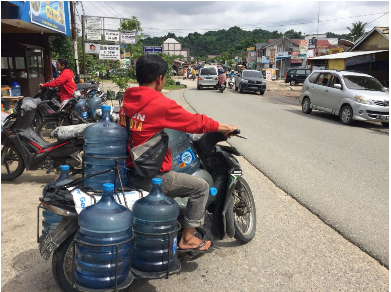
Ein Kurier liefert Wasserrfässer n Samarinda, der Hauptstadt der Provinz Ost-Kalimantan

Die Gebiete Palaran, Nord-Samarinda und Sambutan, in denen 28 Prozent der Bewohner*innen Samarindas leben, sind nicht an das Trinkwassernetz angeschlossen und haben daher noch größere Probleme. Die Wasserquellen mussten dem Kohlebergbau weichen. Bis heute sind dort 394 Gruben zurückgeblieben. Den Bewohner*innen bleiben in Folge dessen nur drei Alternativen: sie können Wasser aus alten offenen Kohlegruben holen, selbst Brunnen bauen oder Trinkwasser in Fässern kaufen. Das Wasser in den zurückgelassenen Gruben ist verschmutzt und die anderen beiden Alternativen sind kostspielig.