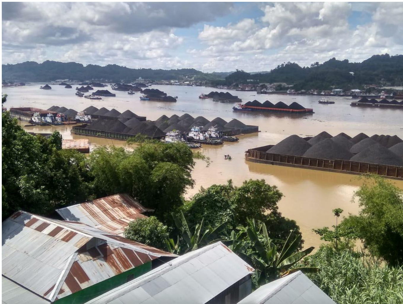
Kohletransporte über den Mahakam-Fluss 2020