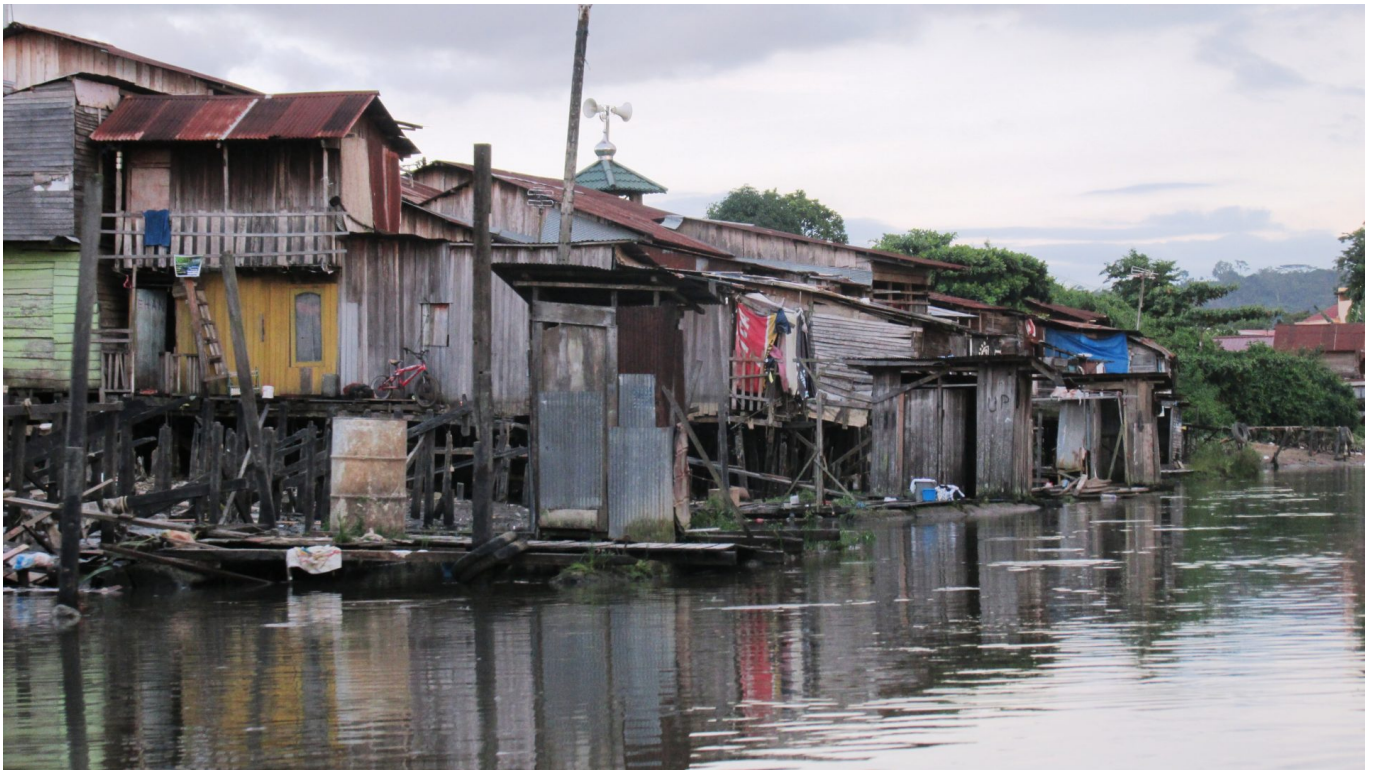
Kampung (Dorf) entlang des Krang Mumus Flusses

Indonesien: Der Mahakam in Kalimantan ist der zweitgrößte Fluss des Archipels. Sein Wasser und sein Ökosystem sind existenziell für Mensch und Umwelt. Der zunehmende Druck auf den Mahakam durch Wasserentnahme und Rohstoffabbau birgt die Gefahr irreparabler Zerstörung.