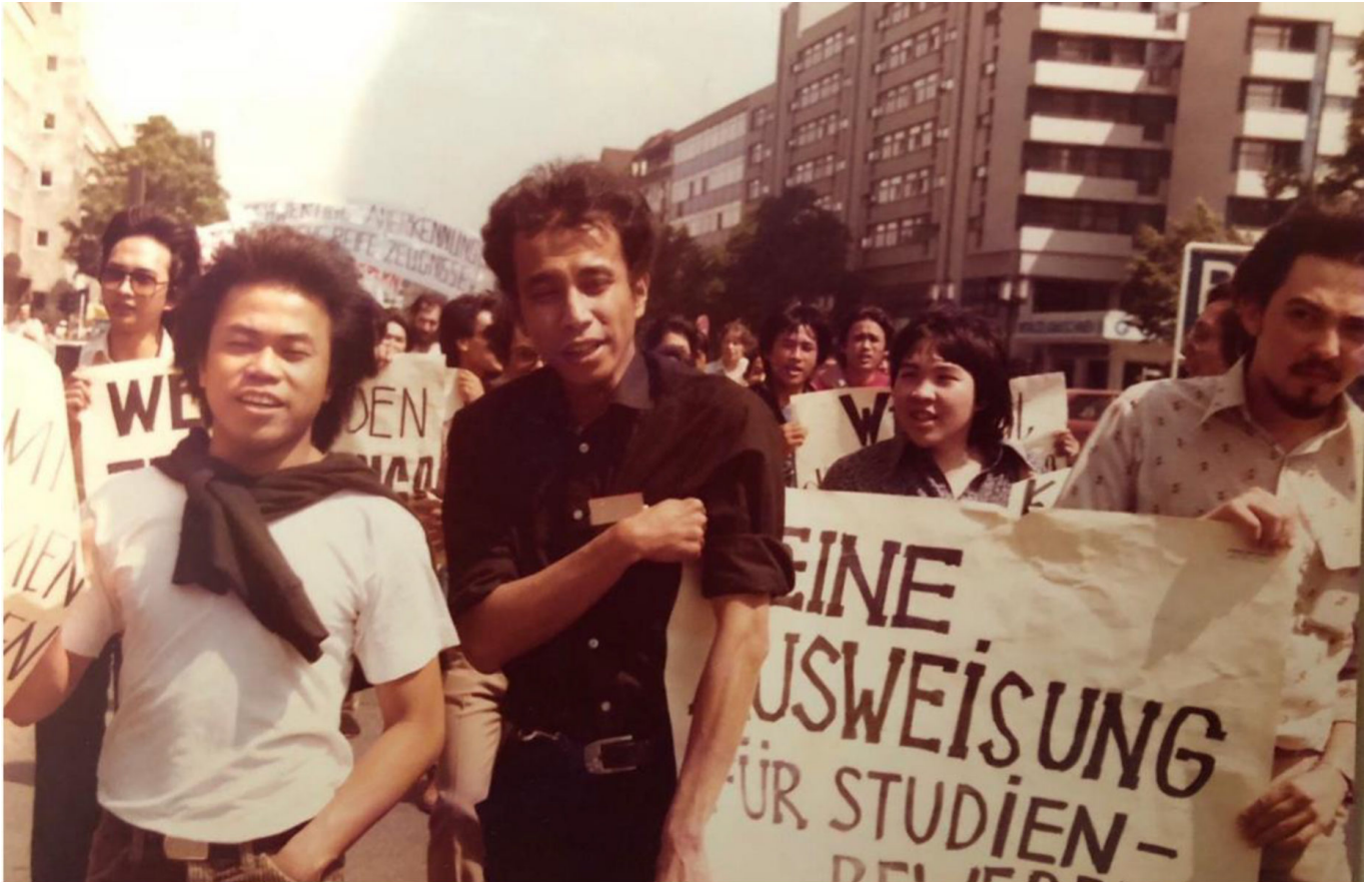
Indonesische Studierende demonstrieren in West-Berlin 1982.