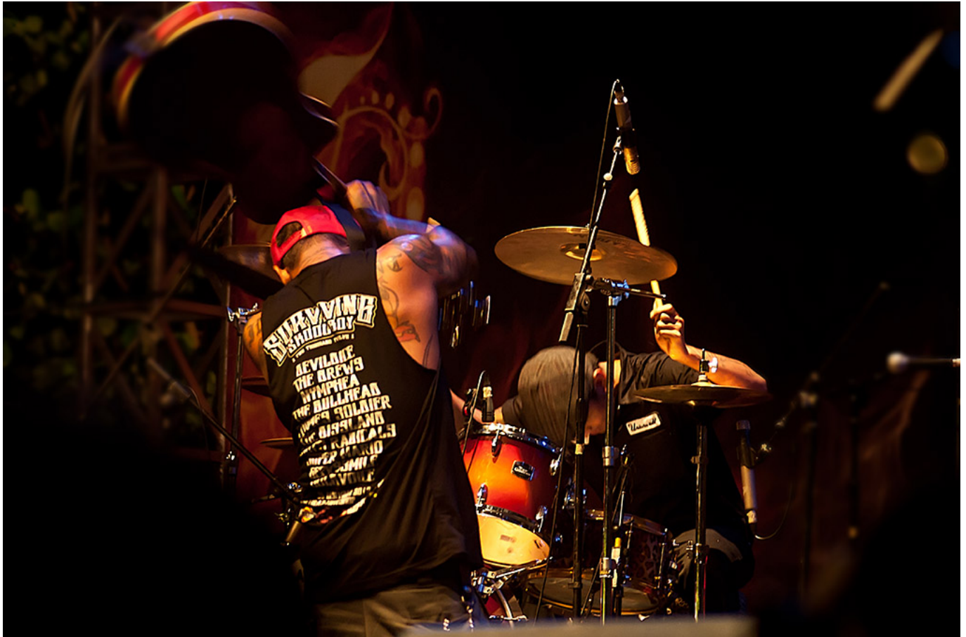
Die bekannte balinesische Punkband Superman Is Dead bei einem Konzert am 28.12.2012.