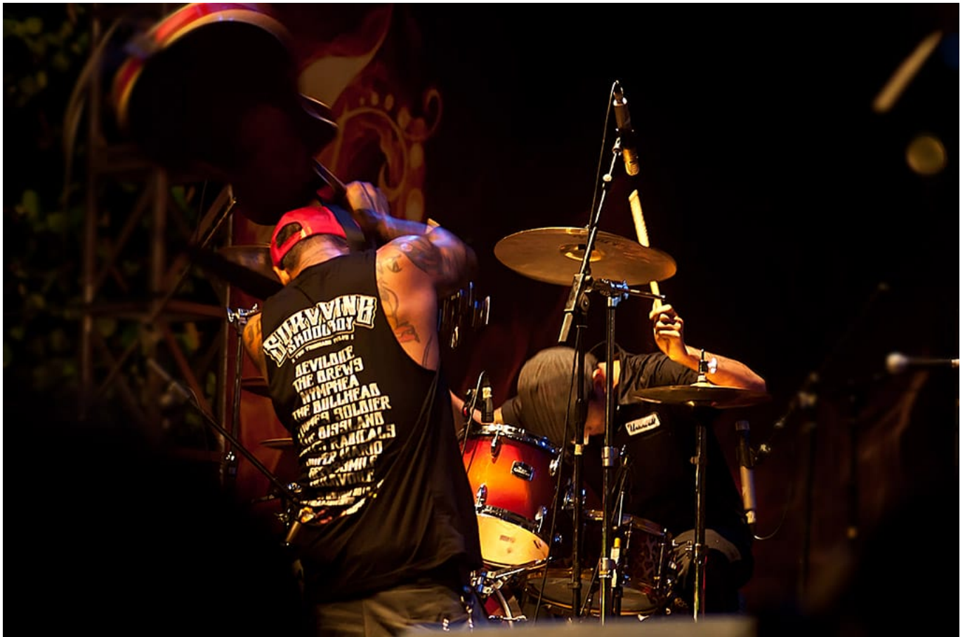
Die bekannte balinesische Punkband Superman Is Dead bei einem Konzert am 28.12.2012.