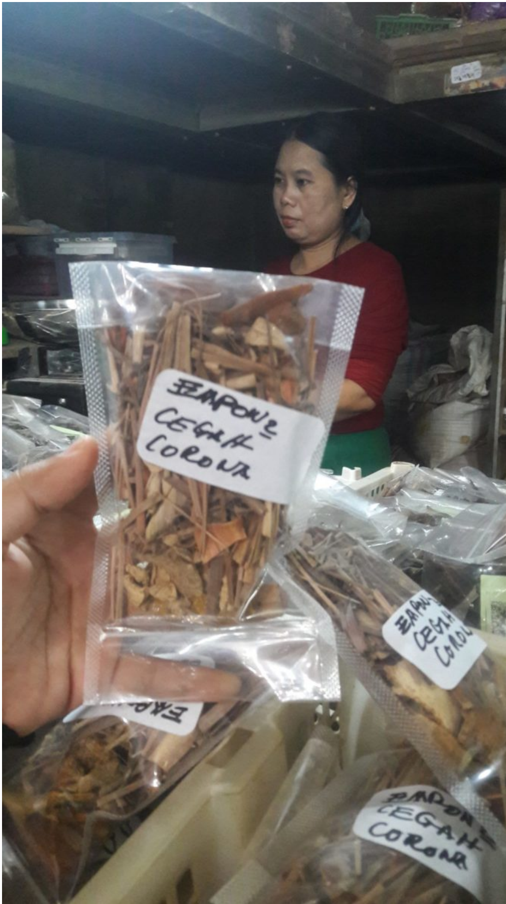
Hausgemachte Anti-Corona Jamu -Kräutermedizin, verkauft auf dem Beringharjo-Markt in Yogyakarta

Die jüngste Geschichte liefert einige gute Gründe, warum medizinische Fachkräfte, Patient*innen