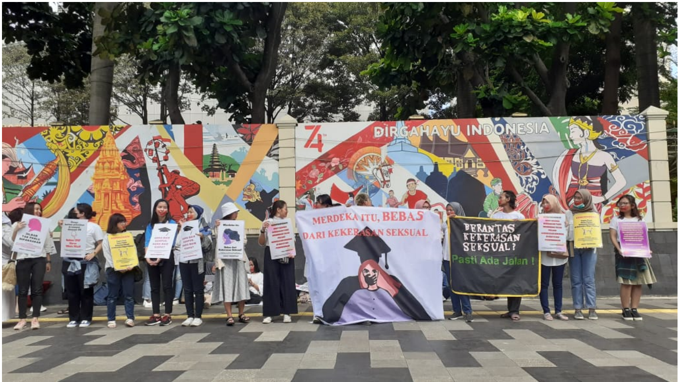
Protest vor dem Bildungsministerium

Einer der wichtigsten Erfolge der Demonstration war für mich, dass ich zum ersten Mal einen Protestwagen gesehen habe, an dem die Gewerkschaftsflagge und die LGBT-Flagge gemeinsam befestigt waren. Dies ist kein alltägliches Bild in Indonesien.