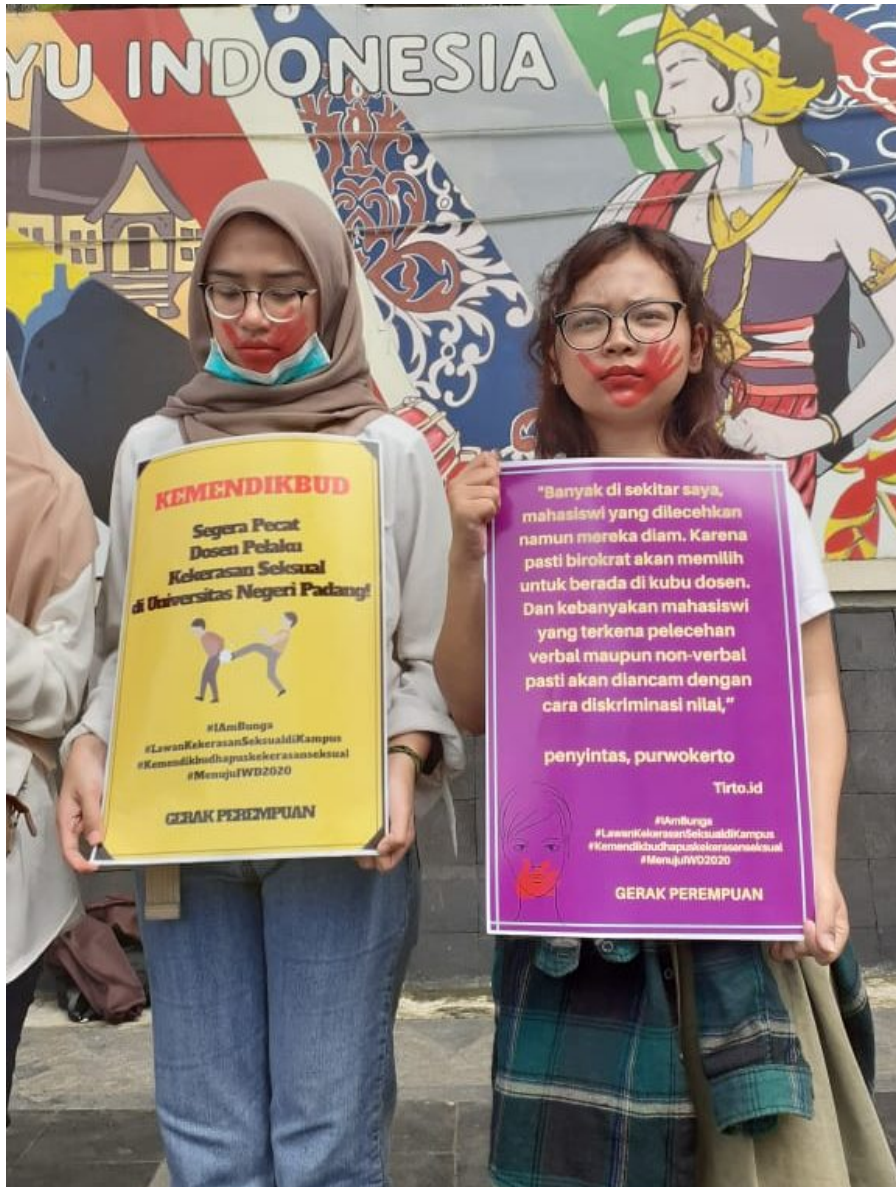
Protest vor dem Bildungsministerium

Zusätzlich zu den veralteten Gesetzen kommt ein juristisches Vakuum hinzu. Beispielsweise gibt es lediglich ein Gesetz zu Kindesmissbrauch und ein Gesetz zu Vergewaltigungen. Die Spannweite dazwischen - also sexuelle Belästigung - ist nach dem indonesischen Recht nicht abgedeckt. Gleichzeitig ist die Definition von Vergewaltigung so eng und spezifisch, dass lediglich die Penetration der Vagina durch einen Penis als Vergewaltigung eingestuft wird. Damit wird außer Acht gelassen, dass die Vagina mit ganz anderen Dingen penetriert werden kann, wodurch rechtsfreie Räume für sexualisierte Gewalt existieren. Die Höchststrafe für Vergewaltiger liegt mit maximal 12 Jahren Gefängnis außerdem weit unter dem Strafmaximum von Hochverrat (20 Jahre).