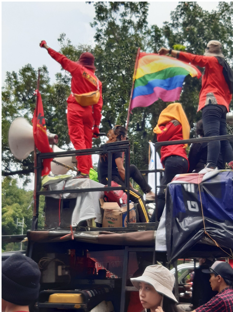
LGBT und Gewerkschaftsaktivist*innen

Schon 2018 gab es ein verstärktes mediales Interesse an der Aufarbeitung von sexuellen Belästigungsfällen, angetrieben durch den sogenannten ‚Agni‘ Fall. Agni ist das Pseudonym einer Studentin, die während ihres von der Universität organisierten Gemeinschaftsdienstes von ihrem Kommilitonen sexuell missbraucht wurde. Warum konnte Ihrer Meinung nach gerade der Agni-Fall so viel öffentliche Aufmerksamkeit auf sich ziehen?