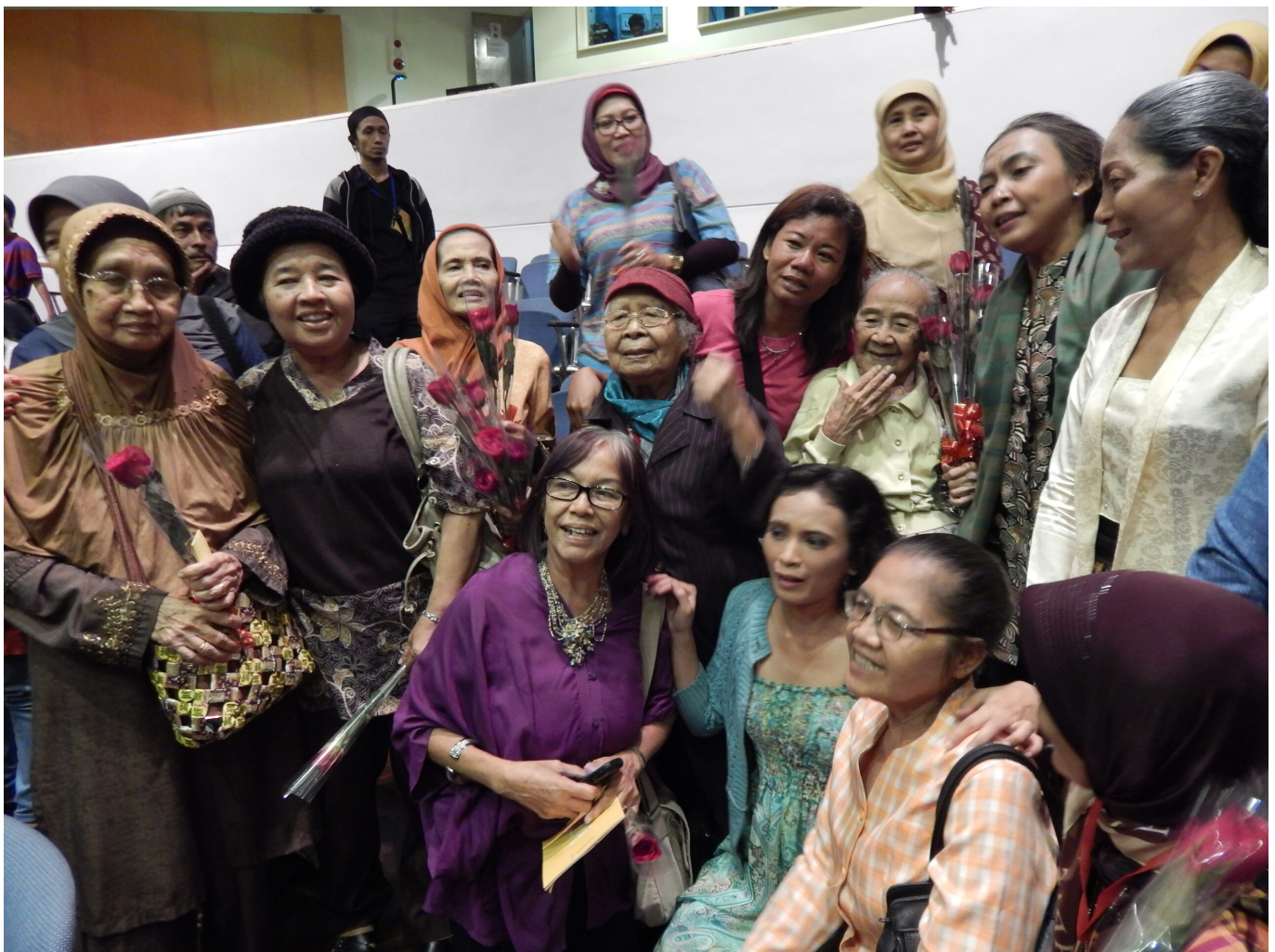
Weibliche Überlebende der Massaker von 1965 mit Schauspielerinnen des 2014 uraufgeführten Theaterstückes Nyanyi Sunyi Kembang-Kembang Genjer/Der schweigende Gesang der Genjer-Blüte .

Diese staatlich verordneten Frauenrollen wurden zu einer Ideologie für jede Frauenorganisation, unter dem Vorwand, dass Mütter oder Frauen dafür verantwortlich seien, eine harmonische Familie zu erhalten und die Entwicklung des Landes zu unterstützen. Die Vereinnahmung der Frauenrolle durch Frauenorganisationen, die vom Staat auferlegt wurde, war sehr effektiv.