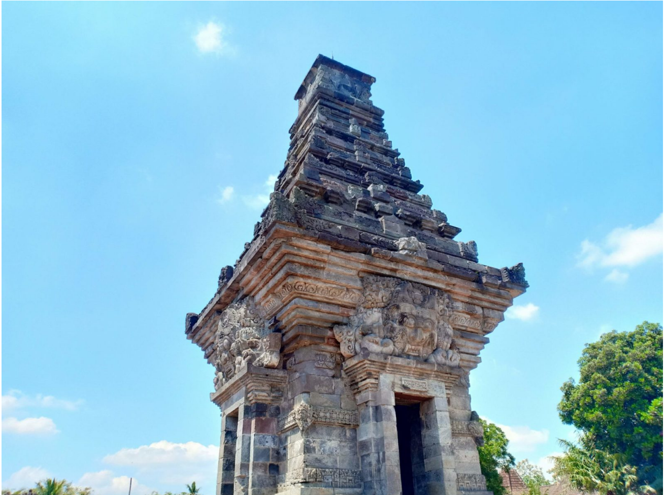
Ein Teil des hinduistischen Penataran Tempel Komplexes auf Java

Traditionell ist Reis für viele Menschen in Indonesien nicht nur wichtig, um das Grundbedürfnis nach Nahrung zu decken, sondern auch eine kulturell heilige Pflanze. Reis wird mit höchstem Respekt behandelt, weil er als göttliche Pflanze angesehen wird . Obwohl die meisten indonesischen Bevölkerungsgruppen heutzutage dem muslimischen Glauben angehören, wird eine der ältesten überlieferten Praktiken der Göttinnen-Verehrung aus der hinduistisch-buddhistischen Periode nach wie vor gepflegt: der Reiskult in Gestalt von Dewi Sri oder der Göttin Shri.