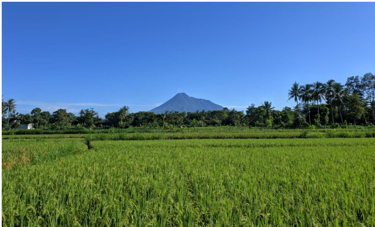
Reisfeld bei Yogyakarta

Sogar nach der Islamisierung, die Anfang des 17. Jahrhunderts die gesamte Halbinsel massiv erfasste, bleibt die Verehrung von Sangiang Serri für die Menschen in Südsulawesi prominent. Im 17. Jahrhundert stellte ein Bericht während einer holländischen Militärexpedition in Südsulawesi fest, dass das Volk der Buginesen es in Kriegszeiten vermeidet, Reisfelder abzubrennen , da sie den Zorn von Sangiang Serri fürchten.