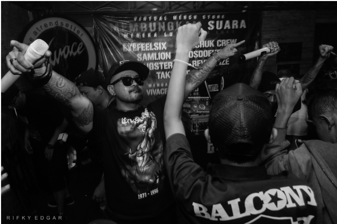
Die Band Eyefeelsix bei einem Auftritt