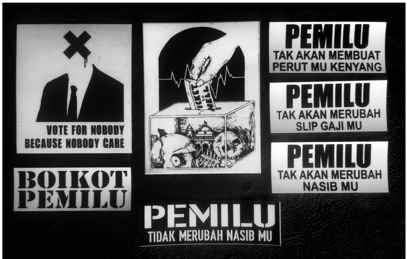
Proteststicker gegen die Wahlen 2019, fotografiert in Bandung

In der Euphorie der reformasi 1998 im gerade demokratisch gewordenen Indonesien liegen gleichzeitig auch die Ursprünge der Bruchstellen dieser Demokratie. Die Verankerung staatsbürgerlicher Rechte braucht emanzipatorisches Potential der Bürger*innen, um freie, vollständige und gleiche Teilnahme im politischen und musikalischen Leben zu erreichen. Dieses Potenzial kann auch als Mittel des Kampfes und des Widerstands gegen Einschränkungen der bürgerlichen Rechte genutzt werden. Wie Karl Marx bereits 1843 anmerkte: „Wir zeigen [der Welt] nur, warum sie eigentlich kämpft, und das Bewusstsein ist etwas, das sie sich aneignen muss, wenn sie auch nicht will.“