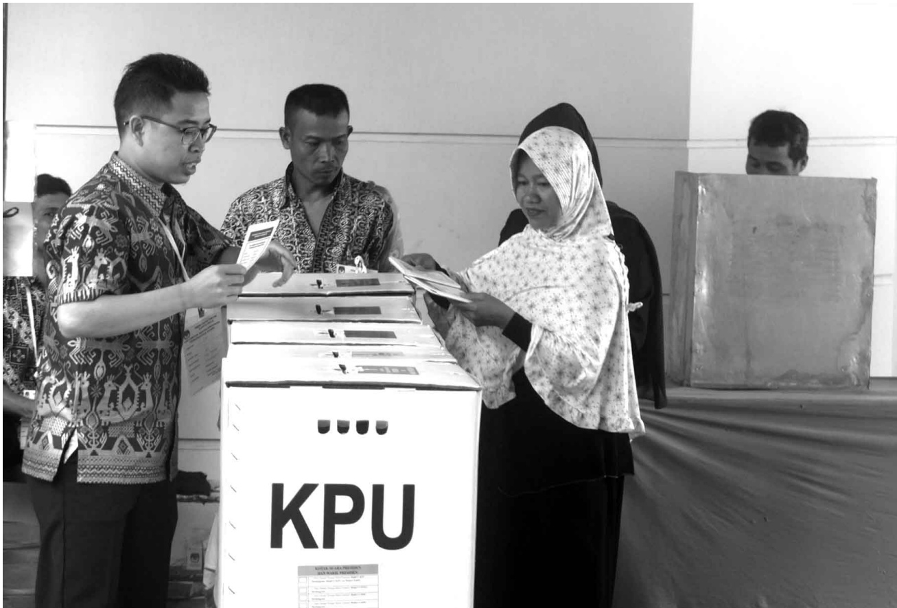
Indonesische Bürger*innen geben ihre Stimme im April 2019 in einem Wahllokal in Bandung ab

Dennoch lernt und entwickelt sich die Öffentlichkeit weiter, weil sie den Wunsch dazu hat, und dieser Wille ist historisch bedingt. Erinnerungen an die dunkle Vergangenheit der Neuen Ordnung motiviert, die aktuelle Situation und Umgebung zu verstehen. Dies geschieht vor allem in Großstädten wie Bandung, die den kulturellen Wandel ihrer Jugend – zum Beispiel durch die Musik – fortwährend erleben. Das revolutionäre Gefühl gibt Enthusiasmus und Mut, alte normative Werte zu durchdringen. Die dezentrale Struktur der Bewegung stärkt die Musik als Vermittler, als gleichberechtigten intellektuellen Partner und mit Memobilisasi Kemukaan eine einfache Darstellung.