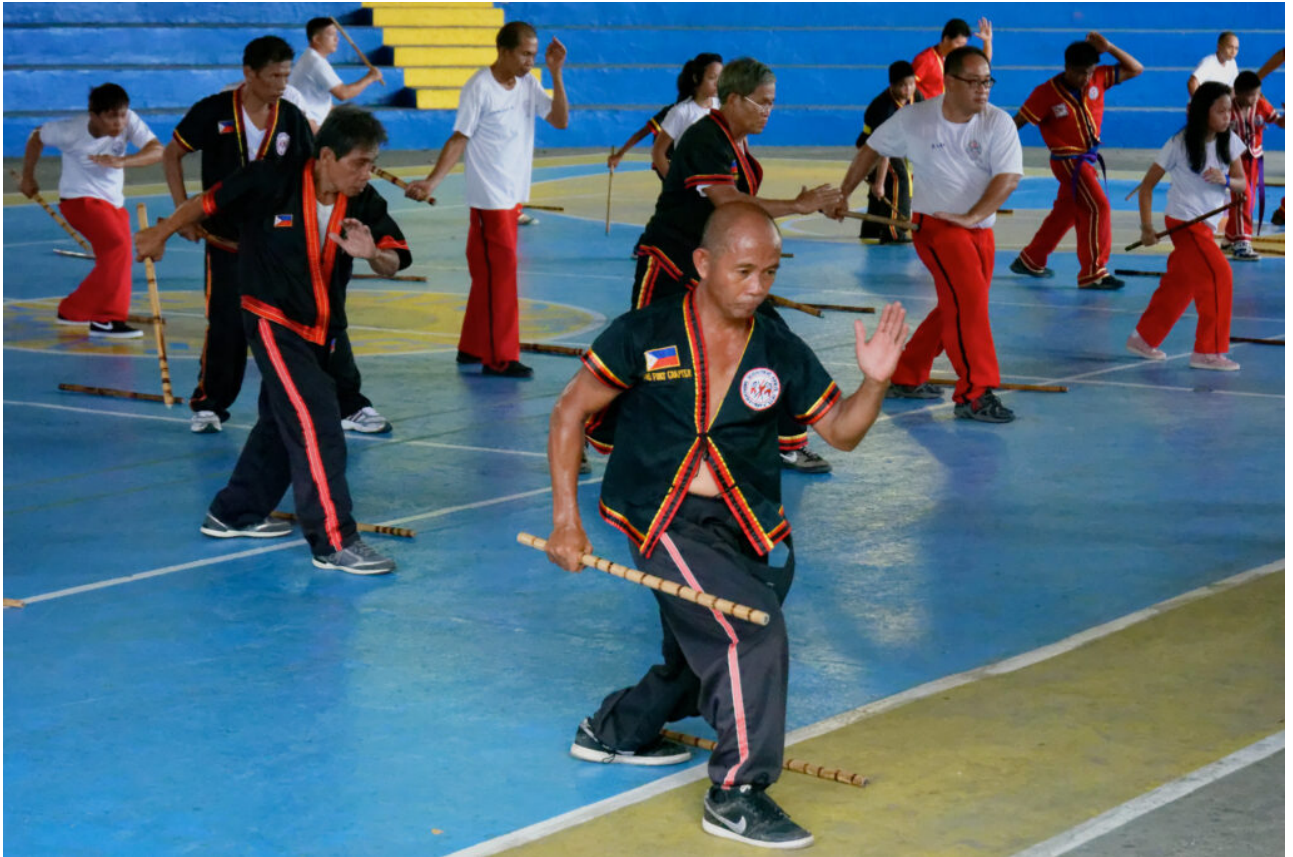
Arnis - philippinischer Kampfsport

Philippinen - Die Geschichte der Kampfkunst Arnis geht weit in die vorkoloniale Zeit zurück. Der philippinische Nationalsport wird heute auch international ausgeübt.