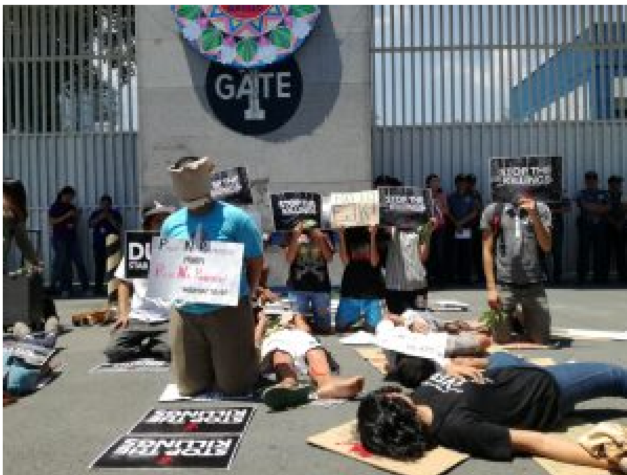
Manila im September 2017: Protest gegen das von der Duterte-Regierung befohlene Morden im so genannten "Drogenkrieg".

In den folgenden sechs Jahren (2004-2010) ist Ressa und ihrem Team der Umbau von ABS-CBN gelungen, von einem Medienhaus, das zuvor unter staatlicher Kontrolle gestanden habe und vielen Politiker*innen gefällig gewesen sei, schreibt Ressa, hin zu einem führenden Medienunternehmen, dass durch journalistische Qualität und Professionalität überzeuge. Ihre Jahre bei ABS-CBN wurden von politischen Querelen der Regierung Gloria Macapagal Arroyo begleitet. 2006 verhängte die Präsidentin aufgrund von Verschwörungen gegen ihre Regierung den nationalen Notstand, infolge dessen wurden Kritiker*innen, Menschenrechtler*innen und Journalist*innen massiv in ihrer Arbeit eingeschränkt. Auch ABS-CBN wurde mit der Schließung gedroht.