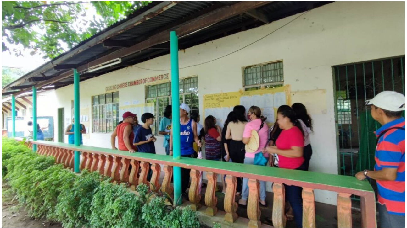
Barangay - Graswurzel der nationalen Politik

Philippinen - Kommunale Politik in den Philippinen zeichnet sich durch Bürgernähe und die Möglichkeit für direktes Engagement aus. Kritisiert werden hingegen Korruption und Machtmissbrauch