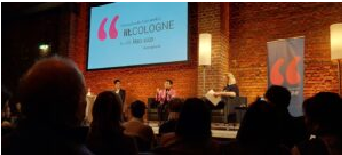
Maria Ressa im März 2023 bei Internationalem Literaturfest Lit Cologne.

Maria Ressa untersucht die Komplexität der Informationslandschaft im digitalen Zeitalter, wie soziale Medien dazu missbraucht wurden, Propaganda zu verbreiten und die Opposition zum Schweigen zu bringen. 2021 kam zum Beispiel heraus, dass die Attacken auf Präsidentschaftskandidatin Leni Robredo und deren Verbreitung online von einer Regierungsstelle finanziert wurden. Ressa's Analyse ist scharfsinnig, und sie liefert den Leser*innen wertvolle Einblicke in die Mechanismen von Online-Desinformationskampagnen und die Herausforderungen, denen Journalisten beim Navigieren durch dieses gefährliche Terrain gegenüberstehen.