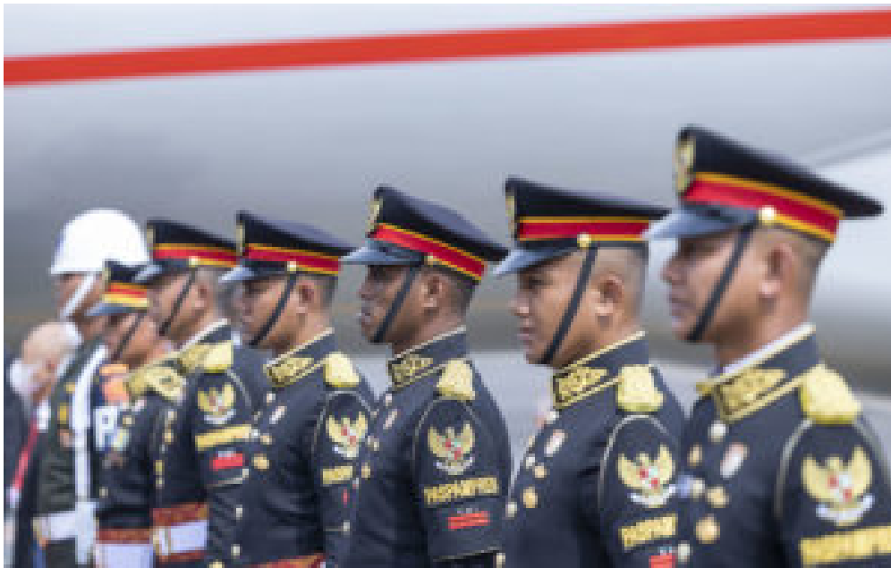
Indonesische Soldaten warten am Flughafen.

Vier Jahre liegt die Leitung der G20 in den Händen großer Schwellenländer Asiens, Afrikas und Lateinamerikas. Ob dies tatsächlich ein ‚Southernising of Global Governance‘, oder zumindest der G20, bedeutet, ist abzuwarten. Die Diskussionen hierzu gestalteten sich in Bali vielseitig: Stolz, Ambition und die Identifikation mit den Herausforderungen globaler Governance vermischen sich mit Fragen nach der Art von ‚leadership‘ (economic, political, intellectual), die unsere Welt benötigt und für welche die Länder stehen wollen. Auch die Frage, welche Rolle Wissenschaft und Think Tanks in der wissenschaftlichen Begleitung und beratenden Unterstützung ihrer Regierungen im Ausfüllen von G20 Präsidentschaften oder der Club Governance Ebene selbst spielen, steht wiederholt im Zentrum des transnationalen Austauschs innerhalb des die G20 beratenden Think20-Prozesses. Welche Beobachtungen und ersten Einschätzungen lassen sich hierzu aus der indonesischen G20 Präsidentschaft ziehen?