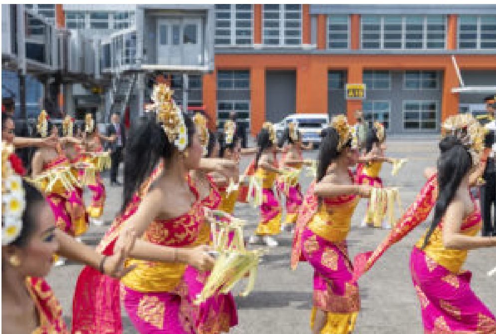
Indonesische Tänzerinnen während des Gipfels.

Besonders hervorzuheben ist dabei die explizite Stellungnahme und Verurteilung des russischen Angriffskrieges. So verkündet der dritte Absatz des Kommuniqués: „Die meisten Mitglieder verurteilten den Krieg in der Ukraine auf das Schärfste und betonten, dass er immenses menschliches Leid verursacht und bestehende Verwundbarkeiten der Weltwirtschaft verstärkt – er hemmt Wachstum, erhöht die Inflation, unterbricht Lieferketten, verschärft Energie- und Ernährungsunsicherheit und erhöht die Risiken für die finanzielle Stabilität.“ Während die Formulierung „die meisten“ anstelle von „viele“ einerseits begrüßt wird, ist zugleich zu beachten, dass der Abschnitt selbst wenig mehr als eine Zitierung der UN Resolution darstellt. Gleich darauf folgt der Hinweis, dass dieser Blick auf den russischen Angriffskrieg und die Sanktionen des Westens nicht von allen G20 Staaten geteilt werden und dass die G20 selbst kein Forum für die Lösung sicherheitspolitischer Fragen darstelle.