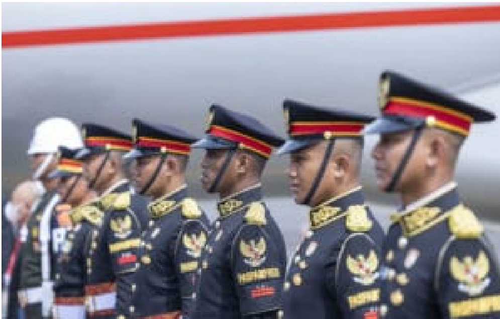
Indonesische Soldaten warten am Flughafen.

Vier Jahre liegt die Leitung der G20 in den Händen großer Schwellenländer Asiens, Afrikas und Lateinamerikas. Ob dies tatsächlich ein ‚Southernising of Global Governance‘, oder zumindest der G20, bedeutet, ist abzuwarten. Die Diskussionen hierzu gestalteten sich in Bali vielseitig: Stolz, Ambition und die Identifikation mit den Herausforderungen globaler Governance vermischen sich mit Fragen nach der Art von ‚leadership‘ (economic, political, intellectual), die unsere Welt benötigt und für welche die Länder stehen wollen. Auch die Frage, welche Rolle Wissenschaft und Think Tanks in der wissenschaftlichen Begleitung und beratenden Unterstützung ihrer Regierungen im Ausfüllen von G20 Präsidentschaften oder der Club Governance Ebene selbst spielen, steht wiederholt im Zentrum des transnationalen Austauschs innerhalb des die G20 beratenden Think20-Prozesses. Welche Beobachtungen und ersten Einschätzungen lassen sich hierzu aus der indonesischen G20 Präsidentschaft ziehen?