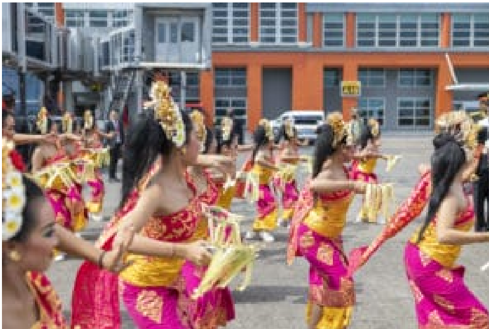
Indonesische Tänzerinnen während des Gipfels.

Besonders hervorzuheben ist dabei die explizite Stellungnahme und Verurteilung des russischen Angriffskrieges. So verkündet der dritte Absatz des Kommuniqués: „Die meisten Mitglieder verurteilten den Krieg in der Ukraine auf das Schärfste und betonten, dass er immenses menschliches Leid verursacht und bestehende Verwundbarkeiten der Weltwirtschaft verstärkt – er hemmt Wachstum, erhöht die Inflation, unterbricht Lieferketten, verschärft Energie- und Ernährungsunsicherheit und erhöht die Risiken für die finanzielle Stabilität.“ Während die Formulierung „die meisten“ anstelle von „viele“ einerseits begrüßt wird, ist zugleich zu beachten, dass der Abschnitt selbst wenig mehr als eine Zitierung der UN Resolution darstellt. Gleich darauf folgt der Hinweis, dass dieser Blick auf den russischen Angriffskrieg und die Sanktionen des Westens nicht von allen G20 Staaten geteilt werden und dass die G20 selbst kein Forum für die Lösung sicherheitspolitischer Fragen darstelle.