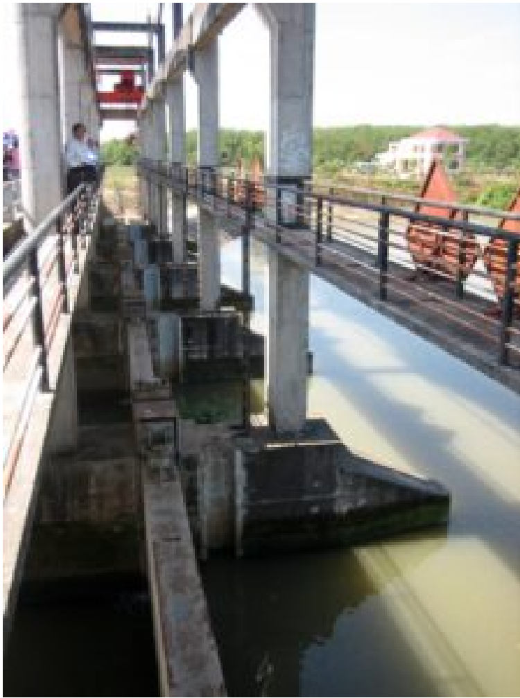
Wasserdurchfluss an einem künstlichen Wehr.

Die internen Probleme des Mekong-Deltas werden durch externe Einwirkungen weiter verschärft. Hierzu zählt die Wasserwirtschaft im Oberstrom (Laos, Kambodscha, China). Dortige Eingriffe in den Wasserhaushalt – zum Beispiel Talsperren – können zu verringerten Abflüssen in die Mekong Arme führen, wodurch die Häufigkeit und die Reichweite des Eindringens von Salzwasser zunimmt.