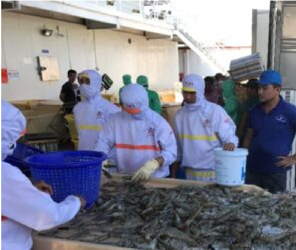
Garnelen werden von Hand sortiert.

Für die süßwassergeprägten landwirtschaftlichen Gebiete werden folgende Konzepte diskutiert oder bereits praktiziert: