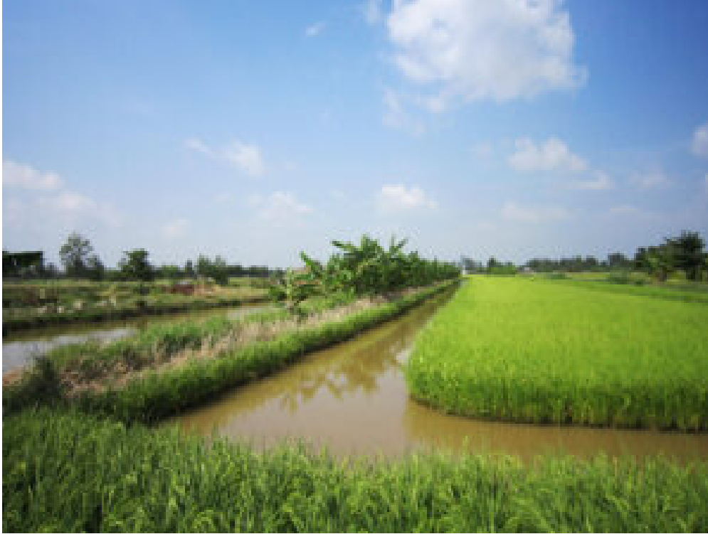
Reis- und Garnelen-Aquakultur im Mekong-Delta

Eine Besonderheit ist der inselartige Bereich ( Lower U Minh ) mit überwiegend Reisanbau und einem Naturschutzgebiet. Es gibt keinen Süßwasserzufluss aus dem Mekong. Er wird allein von Regenwasser gespeist, in Trockenperioden ergänzt durch Grundwasser.