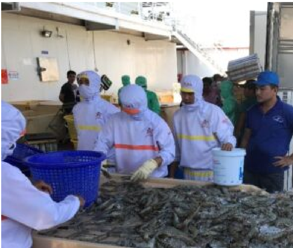
Garnelen werden von Hand sortiert.

Problematisch ist die geringe Flächenverfügbarkeit für Reservoirs. (der größte Flächenanteil wird für die Garnelenzucht verwendet), wirksamer Verdunstungsschutz und die Reinerhaltung des gespeicherten Regenwassers.