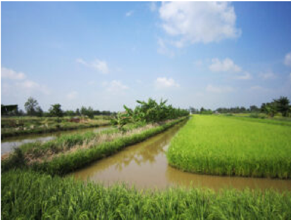
Reis- und Garnelen-Aquakultur im Mekong-Delta

Eine Besonderheit ist der inselartige Bereich ( Lower U Minh ) mit überwiegend Reisanbau und einem Naturschutzgebiet. Es gibt keinen Süßwasserzufluss aus dem Mekong. Er wird allein von Regenwasser gespeist, in Trockenperioden ergänzt durch Grundwasser.