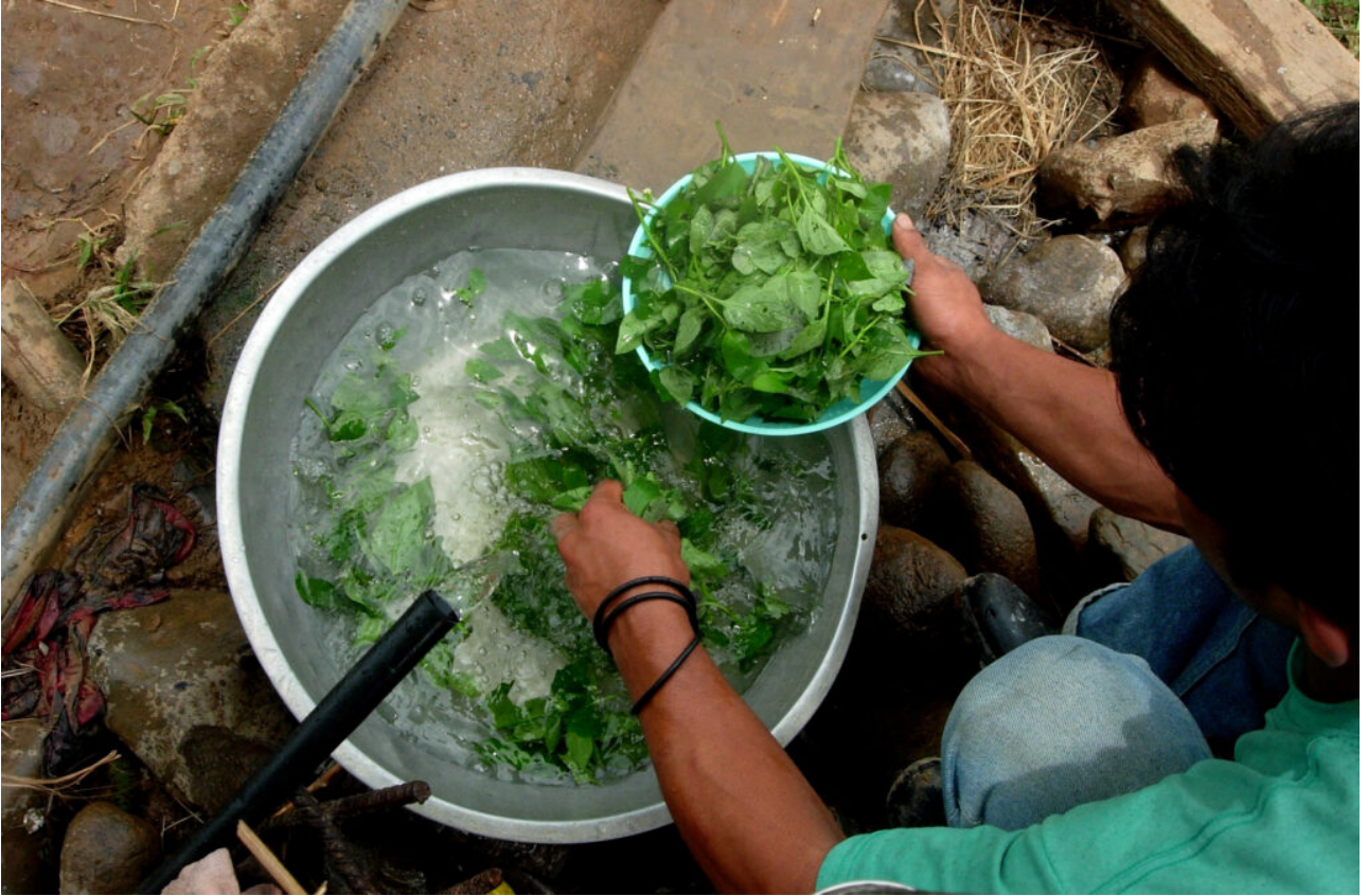
Das Geschäft mit dem Wasser

Philippinen - In Manila dominieren seit vielen Jahren Profitinteressen die Wasserversorgung. Auch in anderen Regionen schreitet die Privatisierung voran - mit fatalen Folgen für die Bevölkerung.