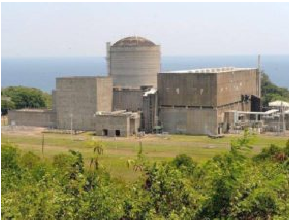
Gebaut, aber nie in Betrieb genommen: das Bataan Nuclear Power Plant BNPP.

Der 5. November 1978 nimmt einen besonderen Platz in der jüngeren Geschichte Österreichs ein. An diesem Tag entschied bei einer Volksabstimmung eine knappe Mehrheit von 50,47 Prozent gegen die Inbetriebnahme des fertig gestellten Atomkraftwerks in Zwentendorf, einem Ort mit rund 4000 Einwohner*innen etwa 40 Kilometer westlich von Wien. Die kommerzielle Nutzung der Kernenergie war somit beendet, ehe sie begonnen hatte. Bestätigt wurde das Ergebnis einige Wochen darauf durch das Atomsperrgesetz, das den Bau von Atomkraftwerken in Österreich verbot. 1999 wurde das Gesetz sogar in den Verfassungsrang gehoben.