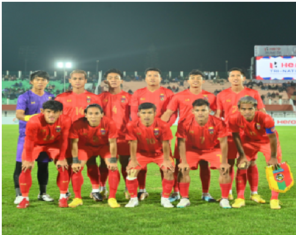
Die Nationalmannschaft Myanmars

Manchester United ist wohl das europäische Team, das in Myanmar am stärksten unterstützt wird. Die meisten älteren Menschen haben sich für "Man U" entschieden, weil sie in den 1990er und 2000er Jahren eine starke Mannschaft waren. Offizielle Fanklubs veranstalten üppige Partys in Luxushotels wie dem Novotel in Yangon für die Anhänger*innen von Man U, der auch der Lieblingsverein vieler Generäle in Myanmar ist.