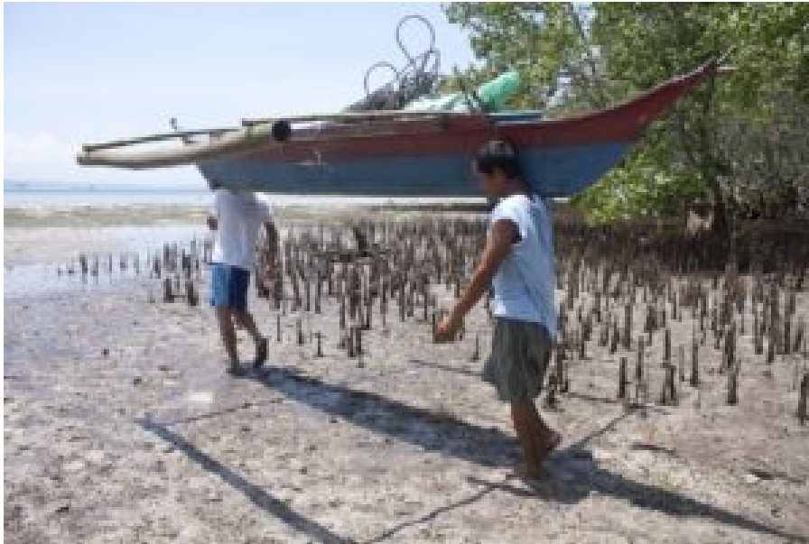
Fischer auf dem Weg zum küstennahen Fischfang

In einer Situation abnehmender Fischbestände greifen Fischer*innen immer häufiger zu destruktiven Methoden. Ich kann mich an keinen einzigen Tauchgang vor der Insel Cebu erinnern, bei dem ich keine Unterwasserexplosion gehört hätte. Dynamit-Fischen ist eine Fischereimethode der Verzweiflung. Dabei werden meist aus Glasflaschen und Sprengstoff selbstgebaute Granaten im Wasser zur Explosion gebracht. Die Druckwelle zerstört die Schwimmblasen der Fische und tötet oder betäubt sie. Diese Methode ist höchst ineffizient, weil von 10 getöteten Fischen nur einer oder zwei an die Oberfläche treiben und eingesammelt werden können, der Rest sinkt zu Boden. Zugleich wird alles Meeresleben im Umkreis geschädigt oder zerstört. Schätzungen gehen davon aus, dass etwa 70.000 der einen Million Kleinfischer*innen in den Philippinen mit Hilfe von Sprengladungen fischen .