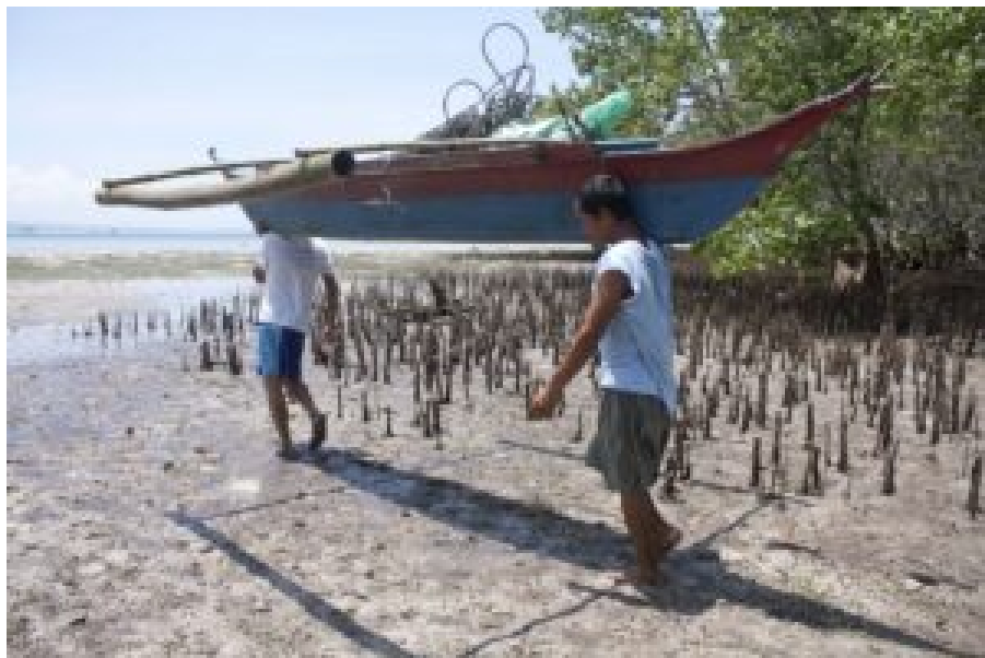
Fischer auf dem Weg zum küstennahen Fischfang

In einer Situation abnehmender Fischbestände greifen Fischer*innen immer häufiger zu destruktiven Methoden. Ich kann mich an keinen einzigen Tauchgang vor der Insel Cebu erinnern, bei dem ich keine Unterwasserexplosion gehört hätte. Dynamit-Fischen ist eine Fischereimethode der Verzweiflung. Dabei werden meist aus Glasflaschen und Sprengstoff selbstgebaute Granaten im Wasser zur Explosion gebracht. Die Druckwelle zerstört die Schwimmblasen der Fische und tötet oder betäubt sie. Diese Methode ist höchst ineffizient, weil von 10 getöteten Fischen nur einer oder zwei an die Oberfläche treiben und eingesammelt werden können, der Rest sinkt zu Boden. Zugleich wird alles Meeresleben im Umkreis geschädigt oder zerstört. Schätzungen gehen davon aus, dass etwa 70.000 der einen Million Kleinfischer*innen in den Philippinen mit Hilfe von Sprengladungen fischen.