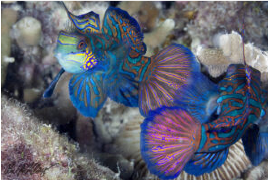
Mandarinfische bei Malapascua.

Die Philippinen liegen im Coral Triangle , dem Weltzentrum der marinen Biodiversität. Hier findet man knapp 600 von insgesamt 800 Riffbildenden Korallen. Zum Vergleich: das australische Great Barrier Reef weist nur knapp 400 Arten auf und liegt damit auf der Biodiversitätsskala an dritter Stelle (Jürgen Freund, Hg.; Sulu-Sulawesi-Seas; Manila 2001). In den philippinischen Wassern findet man 33 Mangrovenarten, 800 Algenarten, mehr als 1.200 Arten von Riffischen, 22 Wal- und Delfinarten. Außerdem leben hier Seekühe ( Dugong ) und Walhaie, die größten Fische der Welt.