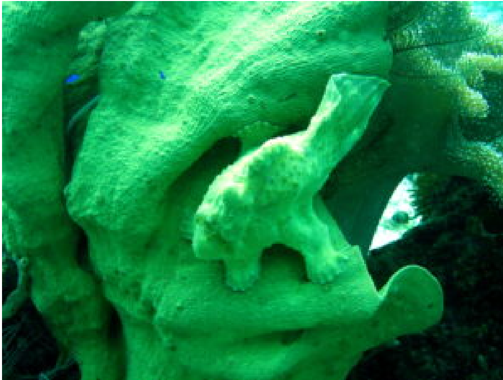
Vom Autor aufgenommener Anglerfisch © Christoph Dehn

Das Tourismusministerium misst dem Tauchtourismus große Bedeutung und ein starkes Wachstumspotenzial zu. Das Ministerium schätzt, dass etwa fünf Prozent der ausländischen Tourist*innen Freizeittaucher*innen sind. Das Einkommen aus Tauchtourismus weltweit wurde für 2022 mit knapp vier Milliarden US-Dollar angegeben. Zahlen für die Philippinen sind nicht bekannt. Man geht aber davon aus, dass Tauchtourist*innen über eine höhere Bildung und ein größeres Einkommen verfügen, mehr Nächte im Land verbringen und pro Tag mehr ausgeben als der Durchschnitt der Tourist*innen. Hinzu kommt eine stark wachsende Zahl einheimischer Taucher*innen.