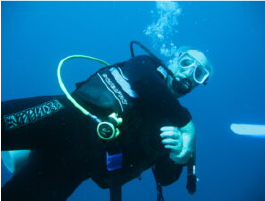
Der Autor unter Wasser.

Halb fünf. Knirschend schiebt sich der Bug des Auslegerboots durch den Sand. Der Boatman gibt einen letzten Stoß, springt auf und wirft den Motor an. Monad Shoal, die versunkene Insel, ist unser Ziel. Ich habe keine Ahnung, wie der Bootsführer sich orientiert, wie er den unsichtbaren Punkt auf dem dunklen Meer ansteuert. Dann springen wir ins Wasser, bald wird die orange-rote Sonne den Horizont erhellen.