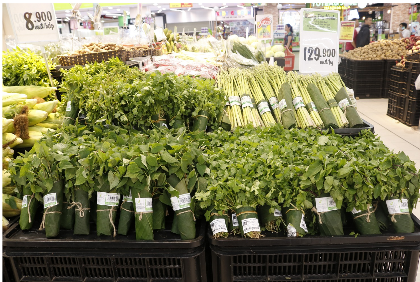
Gemüse in Bananenblättern verpackt

Große Unternehmen beginnen ebenso das Problem des Plastikmülls zu erkennen und denken um. So machte zum Beispiel die Supermarktkette Big C Anfang April 2019 Schlagzeilen, da sie Plastikverpackungen für Gemüse aus ihren Filialen in Hanoi gegen Bananenblätter ersetzten. Bereits zuvor führte Big C Tüten aus Stärke statt Plastik ein und die Rückmeldungen waren nach Angaben der Firma so positiv, dass sie sich entschieden, den nächsten Schritt zu gehen. Ein Sprecher der Unternehmensgruppe CentralGroup sagte, dass sie die Bevölkerung unterstützen möchten, umweltfreundlicher zu konsumieren und den Kund*innen eine Wahl zu geben, wie sie leben möchten. Die Bananenblätter seien aber noch in einer Testphase in ausgewählten Märkten, erklärte CentralGroup in einer Pressemitteilung. Nach dem Probelauf würde entschieden werden, ob die Bananenblattverpackung weiter genutzt werden oder nicht.