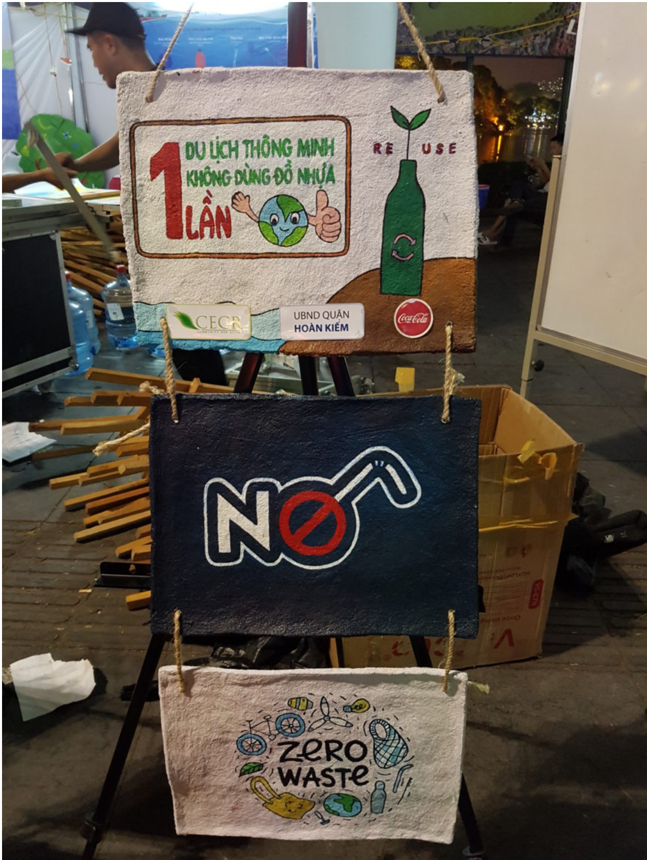
Ausstellung zum Earth Day 2019 am Hoan Kiem See Hanoi