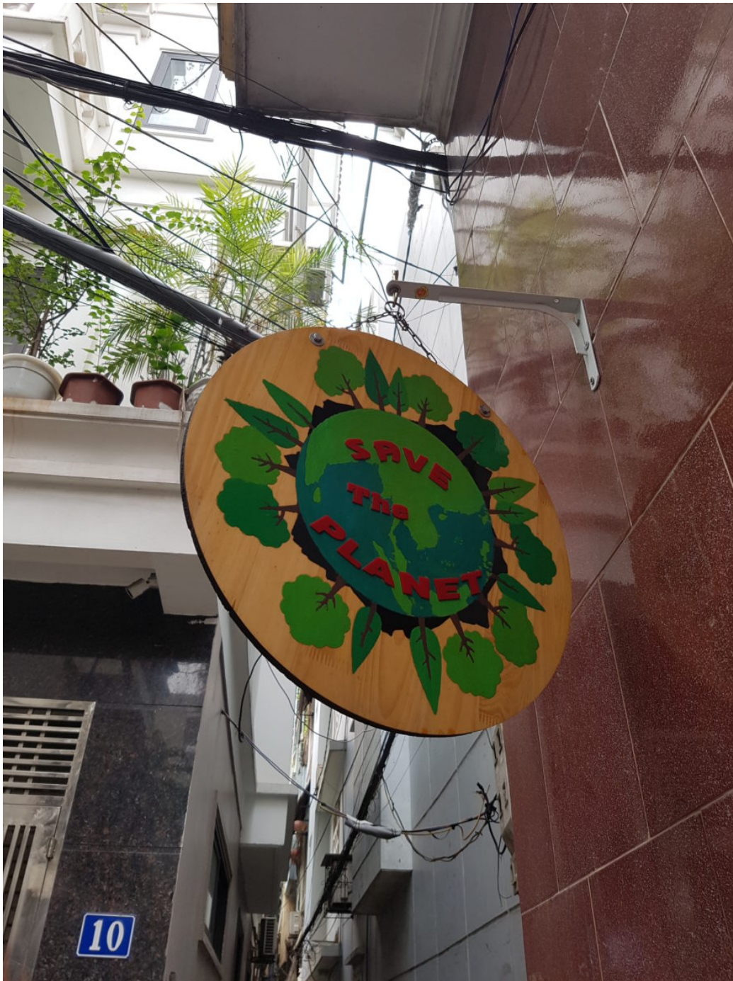
Schild am Zero Waste Laden Hanoi