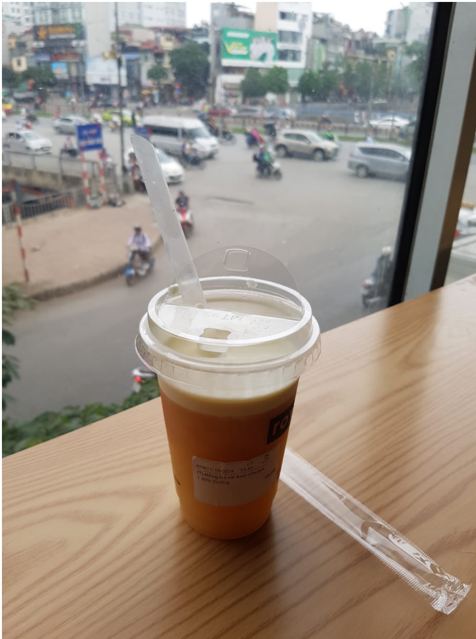
Milktea im Café in Hanoi

Zwar hat Vietnam mit 45 kg pro Jahr/pro Kopf einen geringeren Plastikverbrauch als andere südostasiatische Länder. Dennoch ist Vietnam unter den fünf Ländern, durch die laut einer Studie , die von den Vereinten Nationen beauftragt wurde, am meisten Plastikmüll in die Ozeane gelangt. Dies hat mehrere Gründe. Zum einen hat Vietnam eine sehr lange Küstenlinie. Zum anderen ist das Recyclingsystem nicht ausgebaut. In städtischen Gebieten gibt es zwar eine staatliche Müllabfuhr, allerdings ohne systematische Mülltrennung. Alles wird zusammen entsorgt. Ausnahmen sind private Müllsammler*innen, die wieder verwendbare Stoffe wie Aluminium und Papier sammeln und diese an Firmen weiterkaufen. Die recyceln die Stoffe für die eigene Produktion. Auf dem Land entfällt die staatliche Müllentsorgung – jeweils abhängig von den zuständigen Behörden – teilweise komplett. Die Bevölkerung verbrennt dann meist den anfallenden Müll, ebenfalls ohne Trennung. Nach Berechnungen des Da Nang Centre for Consultancy on Sustainable Development produziert Vietnam pro Tag 19.000 Kubikmeter Plastikabfall. Außerdem ist das Land auch Empfänger von Müllexporten, unter anderem aus Deutschland. Die Zeitung Vietnam News berichtete im April 2019 unter Verweis auf die Vietnam Plastic Association (VPA), dass Recycling-Firmen in Vietnam pro Jahr