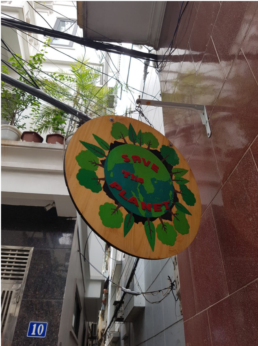
Schild am Zero Waste Laden Hanoi

Thịnh berichtet, dass sie schon länger selbst in der Umweltbewegung aktiv sei. Sie war beispielsweise Co-Organisatorin von Protesten, die sich gegen die Anordnung der Stadtverwaltung in Hanoi im Jahr 2015 richteten. Diese hatte zuvor angeordnet 6700 Bäume fällen zu lassen. Thịnh war auf der Straße und forderte Aufklärung, als die Firma Formosa ihre Giftabwässer ins Meer leitete und daraufhin 70 Tonnen tote Fische in Zentralvietnam angespült wurden. Sie ist Co-Gründerin der Organisation Green Trees und begleitet momentan die Bewegung Save Tam Đảo . Diese Bewegung setzt sich für den Erhalt des Urwaldes im Hanoier Naherholungsgebiet Tam Đảo ein. Momentan ist die Abholzung des Waldes geplant, um Fläche für den Neubau Casinos und Resorts zu gewinnen. Dies könnte zu Bodenerosion im Gebiet führen, zudem wäre der Wasserhaushalt für Pflanzen, Tiere und Menschen in der Umgebung gefährdet.