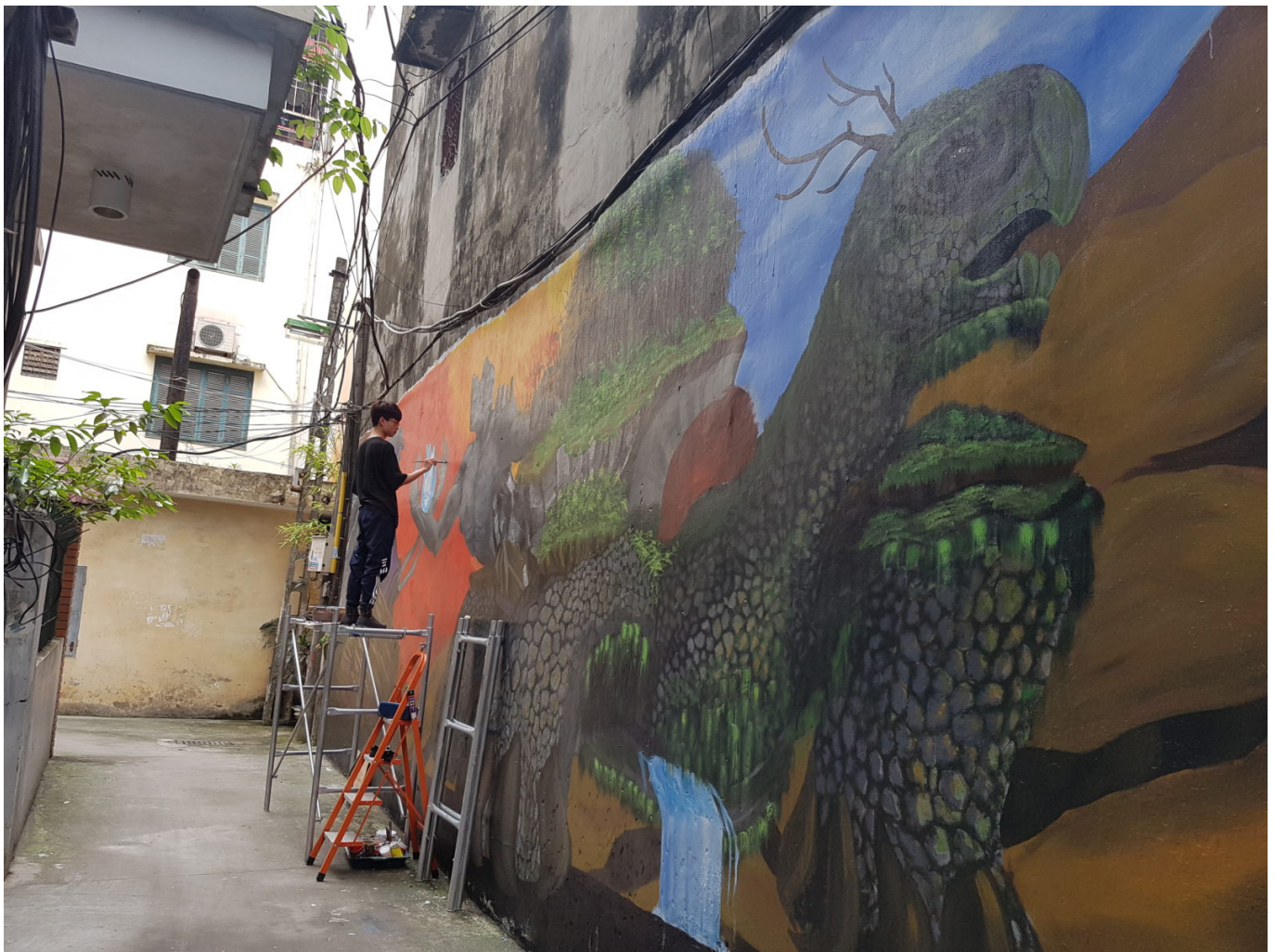
Wandgemälde am Zero Waste Laden Hanoi

Vietnam ist unter den fünf Ländern, durch die am meisten Plastikmüll in die Ozeane gelangt. Weder Anwohner*innen noch Besucher*innen von Hanoi können die Überreste von Plastikverpackungen am Straßenrand übersehen. In den letzten Jahren entwickelten sich Initiativen auf verschiedenen Ebenen mit dem Ziel, Plastikmüll zu reduzieren.