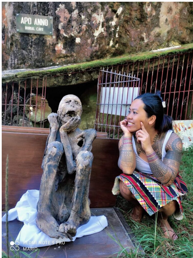
Apo Annos Tätowierungen sind Ate Wamz' größte Inspiration.

Das Wichtigste ist für mich, dass ich die Person persönlich treffe und sie nach ihrer Geschichte fragen kann. Erst wenn ich verstehe, warum sie eine Tätowierung möchte, können wir ein Motiv entwickeln. Ich finde es auch wichtig, den Menschen die Bedeutung und Geschichte der Tattoos zu erklären. Viele wissen nichts über unsere Kultur. Eine Erkenntnis meiner Reise zu den Älteren ist auch, dass ich keine einzelnen Motive gesehen habe. Sieh dir zum Beispiel meine Tätowierungen an. Sie bestehen aus vielen zusammenhängenden Linien. Da gibt es keine einzelne Sonne oder einen einzelnen Mond. Heute gibt es hingegen viele modernisierte Designs. Das hängt auch mit der Nachfrage durch Tourist:innen zusammen.