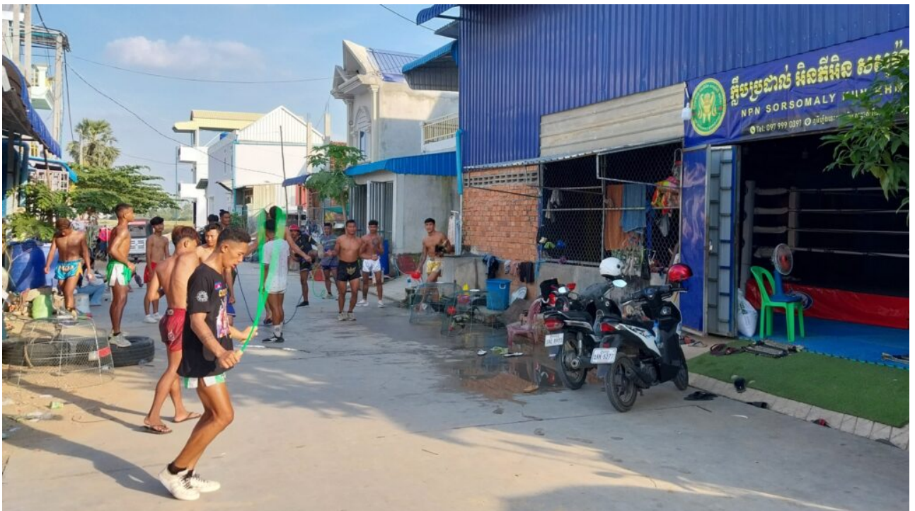
• „Bis heute geht es in meinem Leben nur ums Boxen“