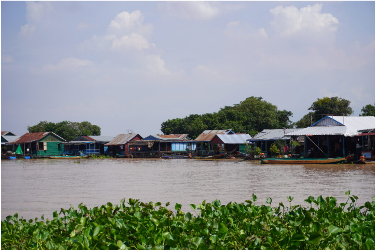
• Tonle Sap: Kambodschas Lebensader in Gefahr