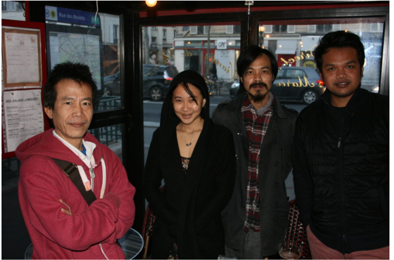
Der Funke, der nicht erlischt