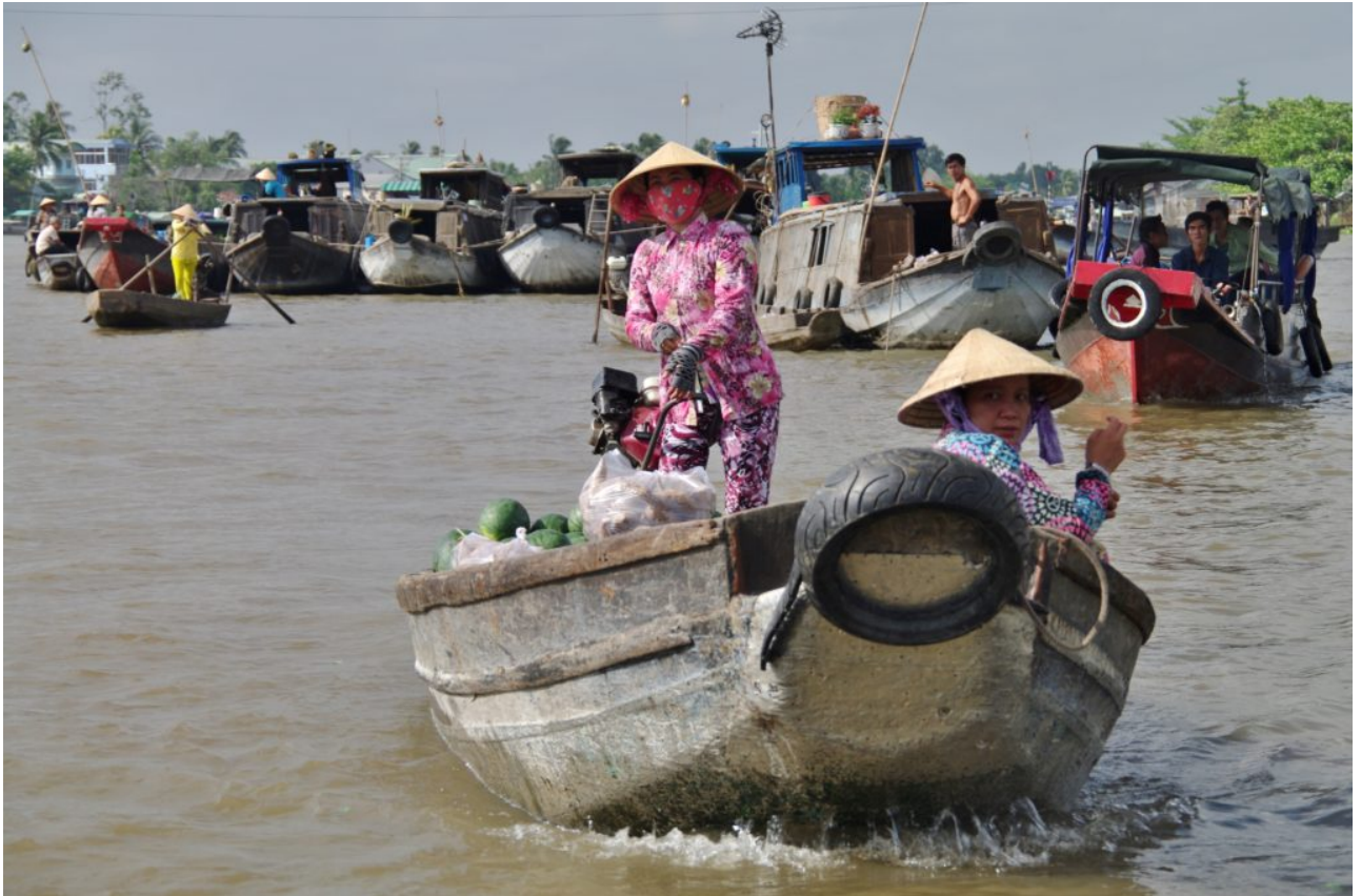
• Mekong - Wassersicherheit in Gefahr

Kambodscha - Der Mekong ist eine Lebensader. Der ungleiche Zugang zu sauberem Wasser wurde während der COVID-19 Pandemie erneut deutlich. Ein Interview mit der Wissenschaftlerin Chanvoitey Horn zum Thema Wasser(un)sicherheit.