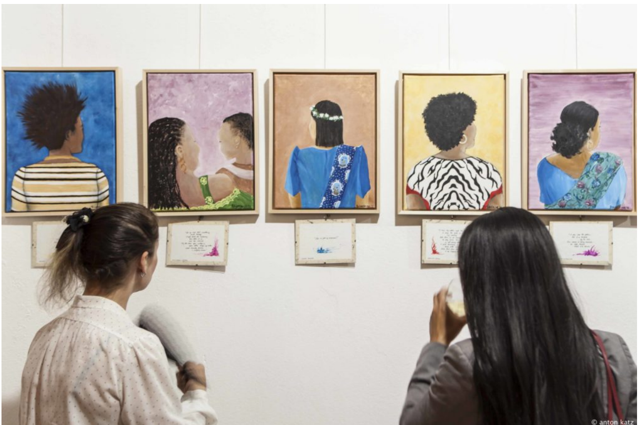
• „Es gibt Menschenhandel in Deutschland“

Kambodscha - Der Mekong ist eine Lebensader. Der ungleiche Zugang zu sauberem Wasser wurde während der COVID-19 Pandemie erneut deutlich. Ein Interview mit der Wissenschaftlerin Chanvoitey Horn zum Thema Wasser(un)sicherheit.