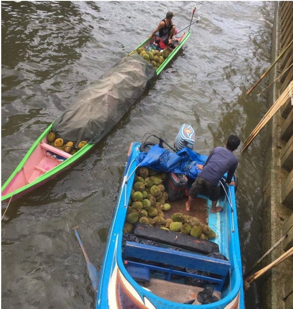
Transport der Durian-Ernte auf dem Kayan-Fluss.

Nicht nur der Extraktivismus bedroht die Durian. In Nordkalimantan heißt die Bedrohung ‚grüne Energie‘. Dort sind, am Kayan und weiteren Flüssen, fünf Staudämme für Wasserkraftwerke mit einer Gesamtkapazität von 9000 Megawatt geplant. Rund 70 Prozent des Stroms sollen in das Industriegebiet und den internationalen Hafen Tanah Kuning-Mangkupadi ( Kawasan Industri dan Pelabuhan Internasional , KIPI) fließen. Der Rest wird zum Teil nach Malaysia exportiert, zum Teil fließt er in andere Gebiete Kalimantanans.