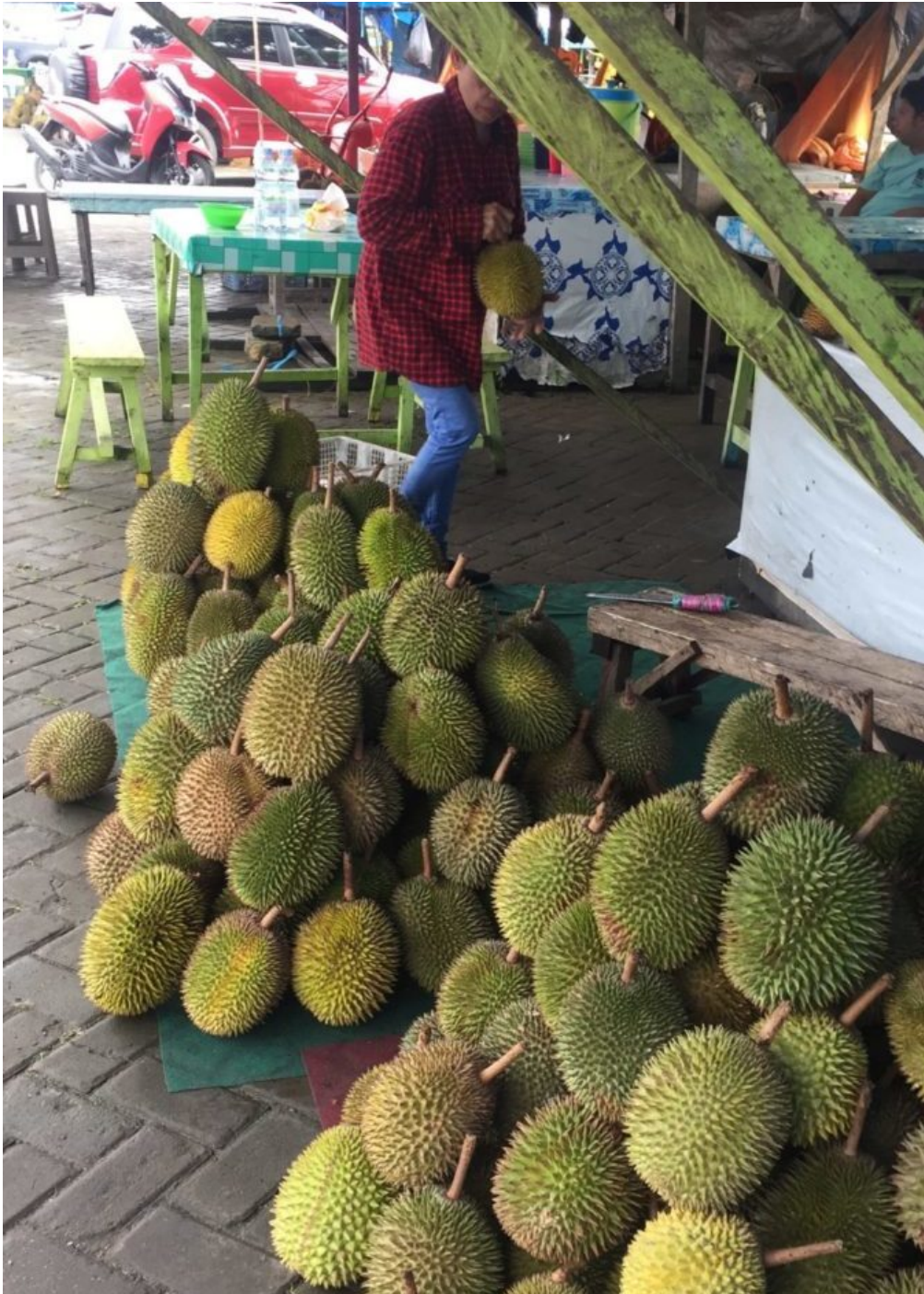
Durian-Verkäufer an den Ufern des Kayan-Flusses in Nord-Kalimantan.

Beginnt die Durian zu blühen, zimmern sich die Menschen einfache offene Hütten ( pondok ) in den Durian-Gärten und wohnen dort zum Teil durchgehend, bis die Durian reifen. In Nordkalimantan bei den Dayak Kenyah in Long Alango gibt es die Tradition des Ngena laboq dian , was so viel bedeutet wie ‚Warten bis die Durian fällt‘. Immer zur Durian-Zeit ziehen Menschen in ihre pondok und bleiben dort, bis die letzte Durian vom Baum gefallen ist. In Long Alango leben Menschen seit sieben Generationen mit und von den Durian-Bäumen, deren Stämme so dick sind, dass zwei Erwachsene sie mit ihren Armen kaum umfassen können.