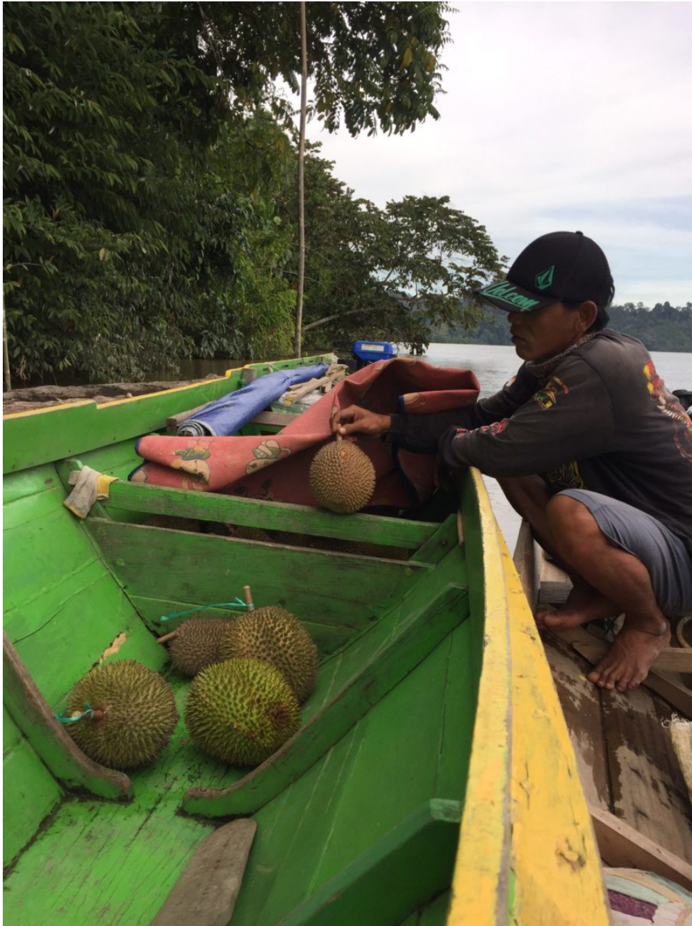
Durian-Ernte © Sarah Agustio