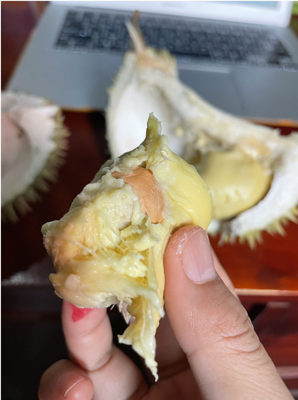
Das Fruchtfleisch einer Durian.

und modernisiert werden musste. Der außergewöhnliche Reichtum seiner Natur machte den ‚fernen Osten‘ zur kolonialen Frontlinie in einem Kampf, dessen Ziel die Unterwerfung von Natur und Kultur darstellte.