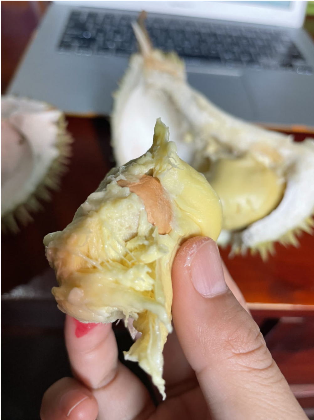
Das Fruchtfleisch einer Durian.

Zwar endete die Kolonialherrschaft Mitte des 20. Jahrhunderts. Doch der Traum von der Modernität verschwand nicht aus den ehemaligen Kolonien. Die neuen Nationalstaaten setzten die westliche Betrachtungsweise und Praxis fort, in der Fortschritt in Form von Wirtschaftswachstum gemessen wurde. Der peruanische Soziologe Anibal Quijano bezeichnete die Tatsache, dass auch nach dem Verschwinden der Bürokratie der Besatzer eine koloniale Logik das Regierungshandeln prägt, als „Kolonialität der Macht“ .