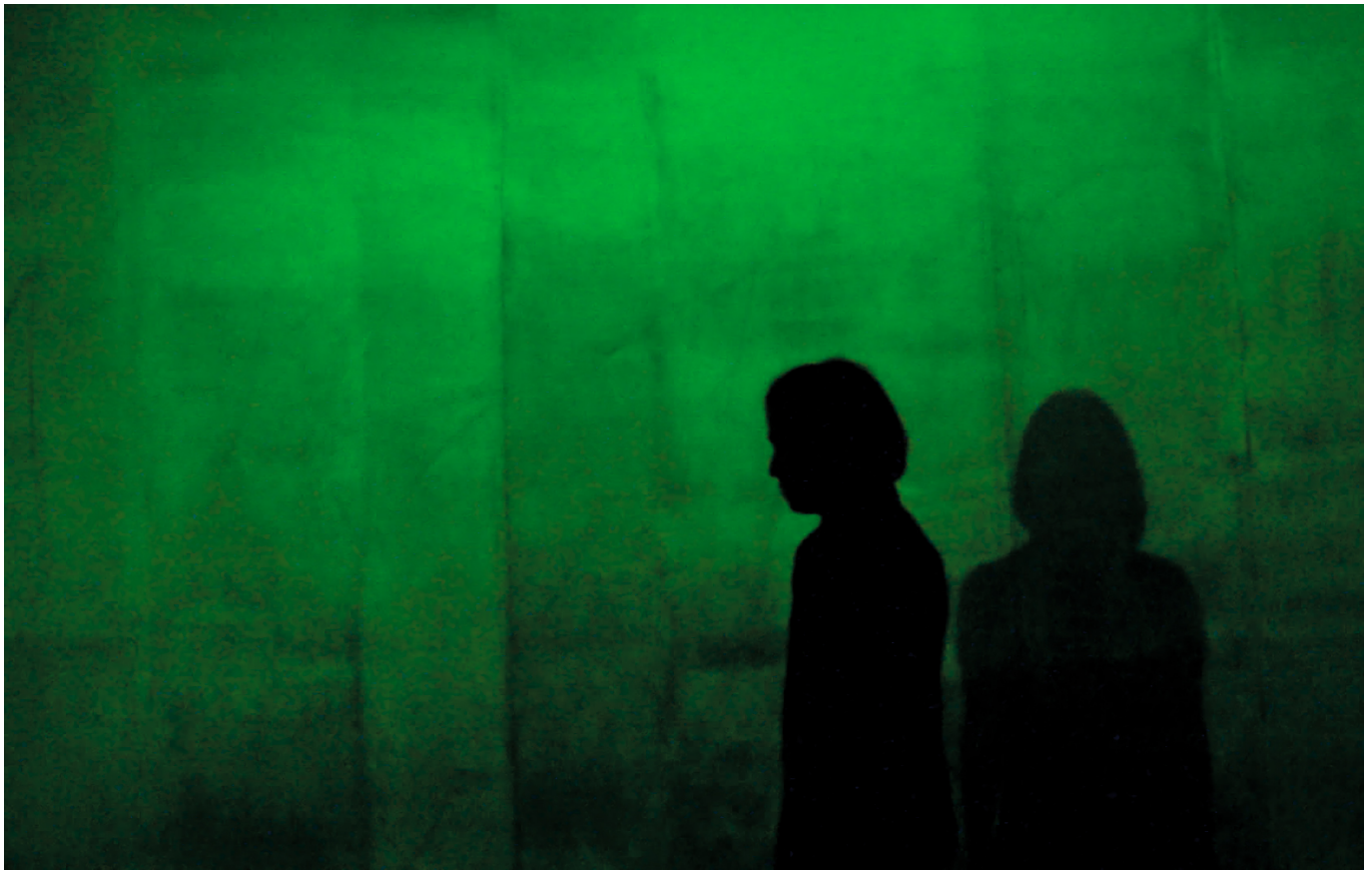
Ausschnitt Filmszene The Cleaners © Gebrüder Beetz Filmproduktion

Internetanbindung und fleißigem Personal, das die westlichen Werte- und Moralvorstellungen teilt. Beides bieten und liefern die Philippinen: eine gute digitale Infrastruktur in den Zentren des Inselstaates, eine Bevölkerung, die digital affin ist und deren Löwenanteil überdies einem innigen katholischen Glauben anhängt.