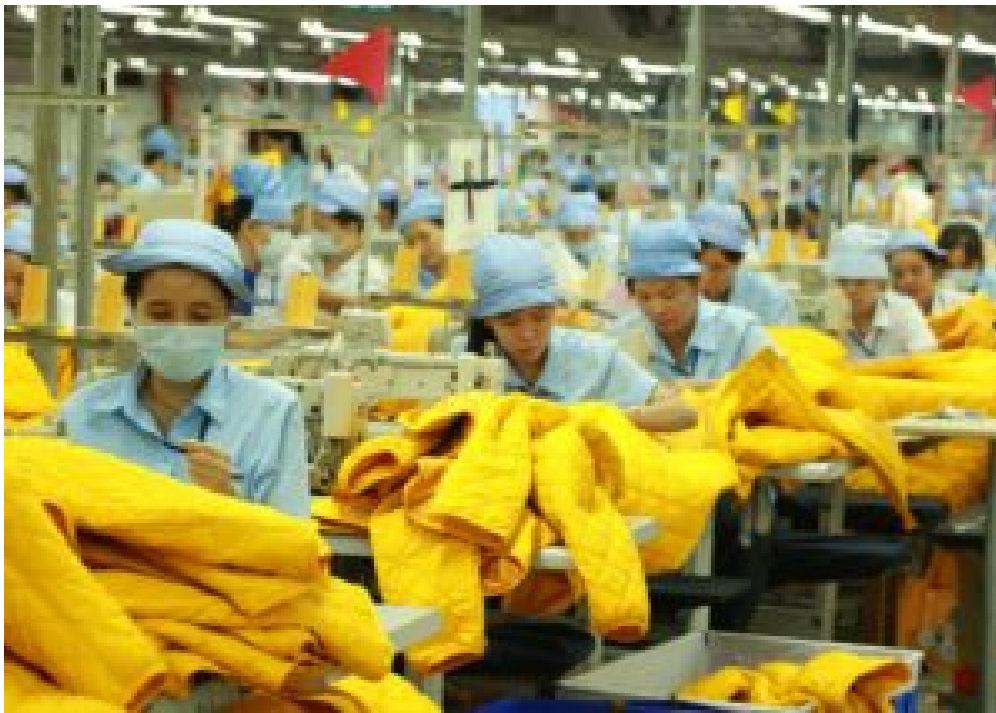
Textilarbeiter*innen in Vietnam

Entwicklungspolitiker*innen räumen ein, dass die derzeitige globale Entwicklungsagenda der Vereinten Nationen , die Agenda 2030 und ihre 17 Ziele für nachhaltige Entwicklung (SDGs), sieben Jahre vor dem Ablauf der Frist nicht auf dem richtigen Weg sind.