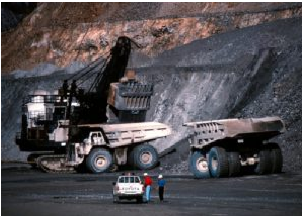
Die Grasberg-Mine des US-Konzerns Freeport im indonesischen Westpapua