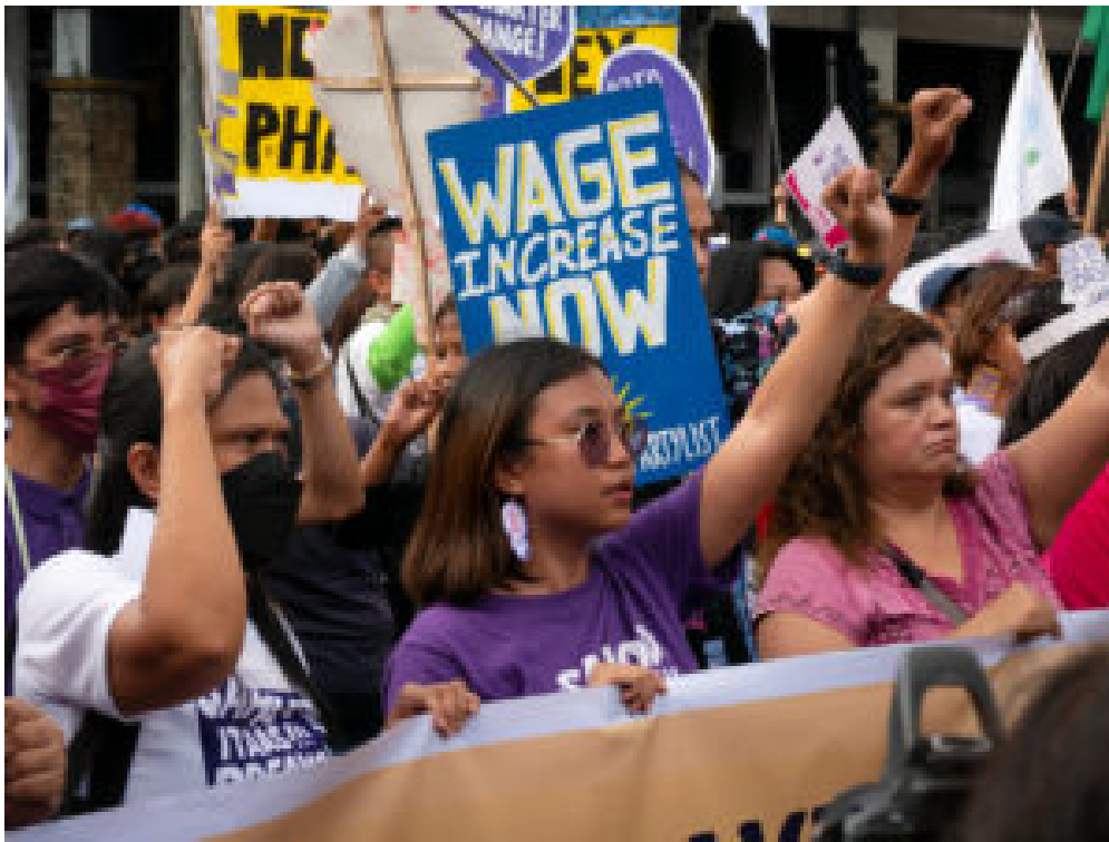
Proteste am Internationalen Frauentag 2023 in Manila

Offene Adern sind auch heute noch eine Realität im Globalen Süden. Ende 2022 hieß es in einer Presseerklärung der UN-Konferenz für Handel und Entwicklung : “Die Entwicklungsländer finanzieren die entwickelten Länder” . Ähnlich lauten die Ergebnisse der Studie Plunder in the Post-Colonial Era: Quantifying Drain from the Global South Through Unequal Exchange, 1960-2018 aus dem Jahr 2021, in der festgestellt wird, dass zwischen 1960 und 2017 Ressourcen im Wert von 152 Billionen US-Dollar (142,5 Billionen Euro) aus dem Globalen Süden abgezogen wurden.