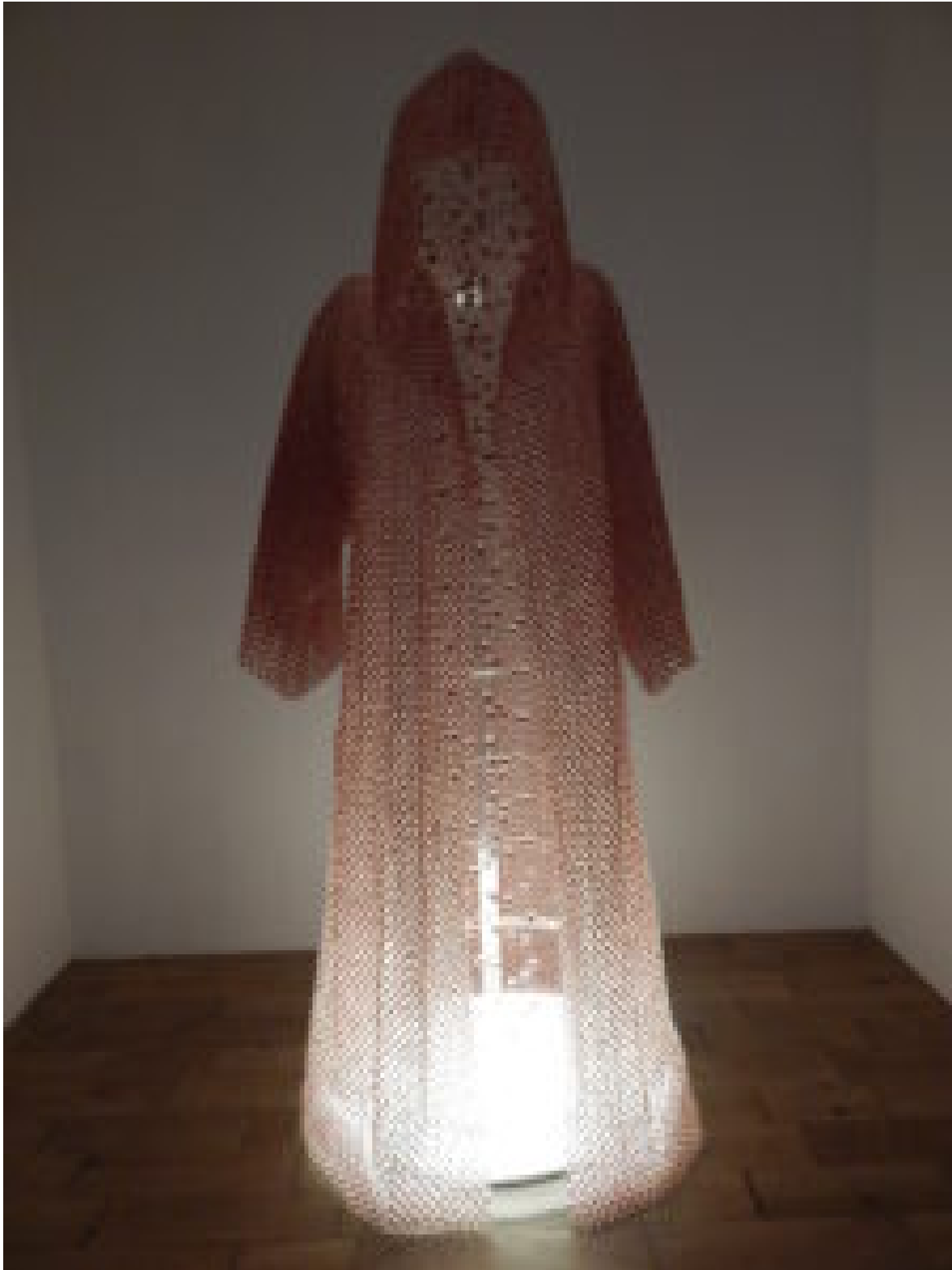
Das Werk History repeats itself der Künstlerin Titarubi, ausgestellt 2014 im Rahmen der ArtJog in Yogyakarta.