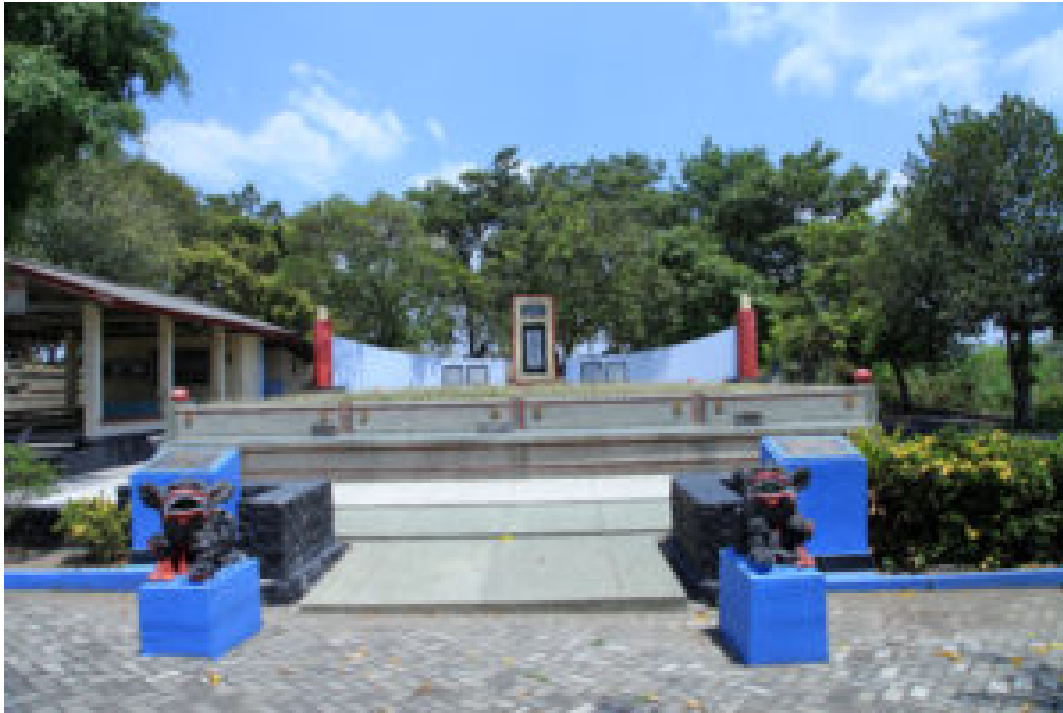
Massengräber in Nganjuk für chinesischstämmige Opfer der Massaker von 1948-1949 in Ost-Java.