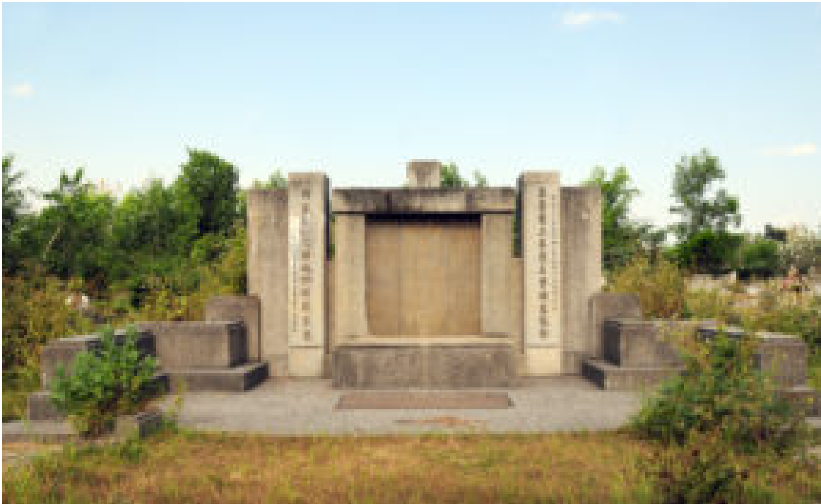
Massengräber in Tulungagung für chinesischstämmige Opfer der Massaker von 1948-1949 in Ost-Java.

1967 wurden Gesetze eingeführt, die darauf abzielten, alle Indonesier ethnisch chinesischer Abstammung zu diskriminieren. Eine Reihe von Gesetzen verbot die Verwendung chinesischer Namen, Schriften und Schriftzeichen, kultureller Veranstaltungen oder Feiern. Familien wurden gezwungen, ihre Namen zu ändern und alle anderen Aspekte ihres ‚Chinesisch-Seins‘ zu verbergen. Ethnische Chines*innen wurden auch von Positionen im öffentlichen Dienst ausgeschlossen, viele zogen in abgeschirmte und geschützte Wohnsiedlungen.