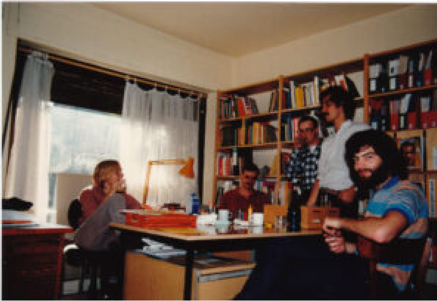
Redaktionsmitglieder der „Südostasien Informationen“ im Jahr 1985

Publikationen der Kontakt und Dialog mit Autor:innen, Aktivist:innen und Journalist:innen in der Region.