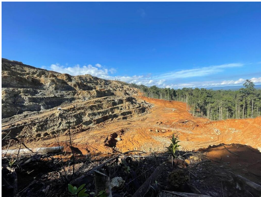
Die Nickelmine Weda Bay von Eramet auf dem Territorium der Hongana Manyawa auf der indonesischen Insel Halmahera.