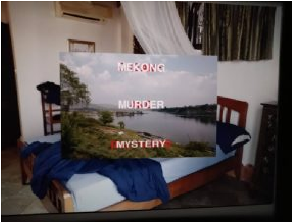
Apichatpong Weerasethakul: Mekong Murder Mystery .

Vor allem ein visueller Denker, arbeitet Apichatpong nur begrenzt mit Worten. Wenn er sie benutzt, tragen sie wenig zum Prozess des Verständnisses bei. Wörter sind unzureichend, wenn nicht komplett hinderlich, um die Gesamtheit des Menschseins und menschliche Erfahrungen zu erfassen. In einer sehr langen Szene sehen wir Jessica, als sie sich müht, den Klang in ihrem Kopf zu beschreiben. Die Wörter nähern sich, aber sind nie ‚genau richtig‘. Wenn der ältere Hernan seine Wahrnehmung der Welt zu erklären versucht, versteht ihn Jessica nur, als sie dessen Fähigkeit kurzfristig selbst erwirbt und vergangenes Geschehen auch ‚hören‘ kann.