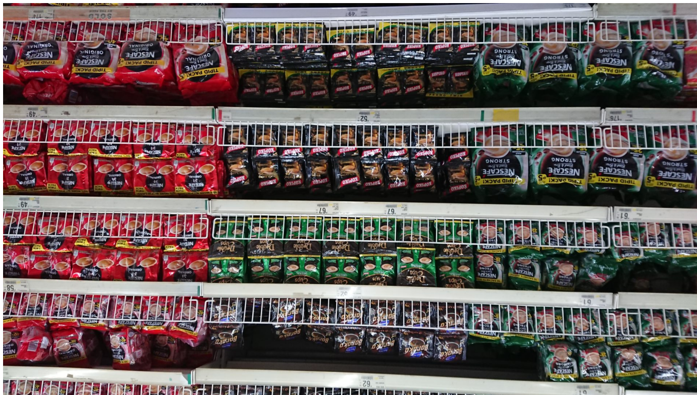
Kaffee-Sachets in philippinischem Supermarkt

In Gesprächen mit Akteur*innen aus Cebu City habe ich einen ähnlichen Eindruck gewonnen, allerdings ist die junge Umweltszene zwar sehr aktiv aber kaum organisiert. Welche Eindrücke hast du von der Umweltbewegung in Manila erhalten?