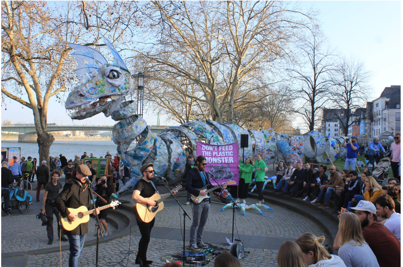
Plastikmonster bei der „Ship it Back“ Kampagne in Köln