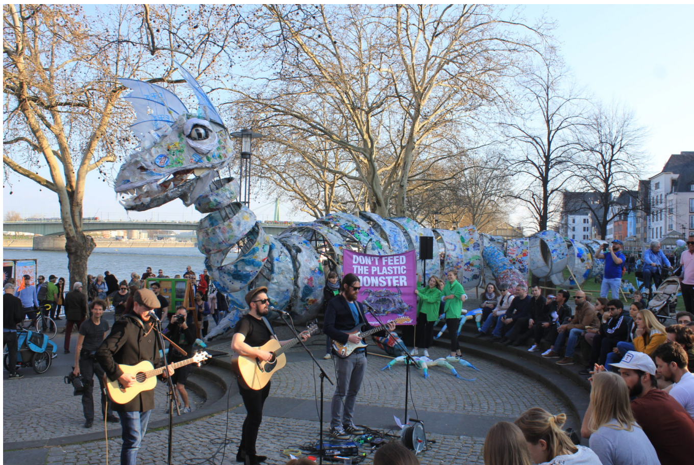
Plastikmonster bei der „Ship it Back“ Kampagne in Köln