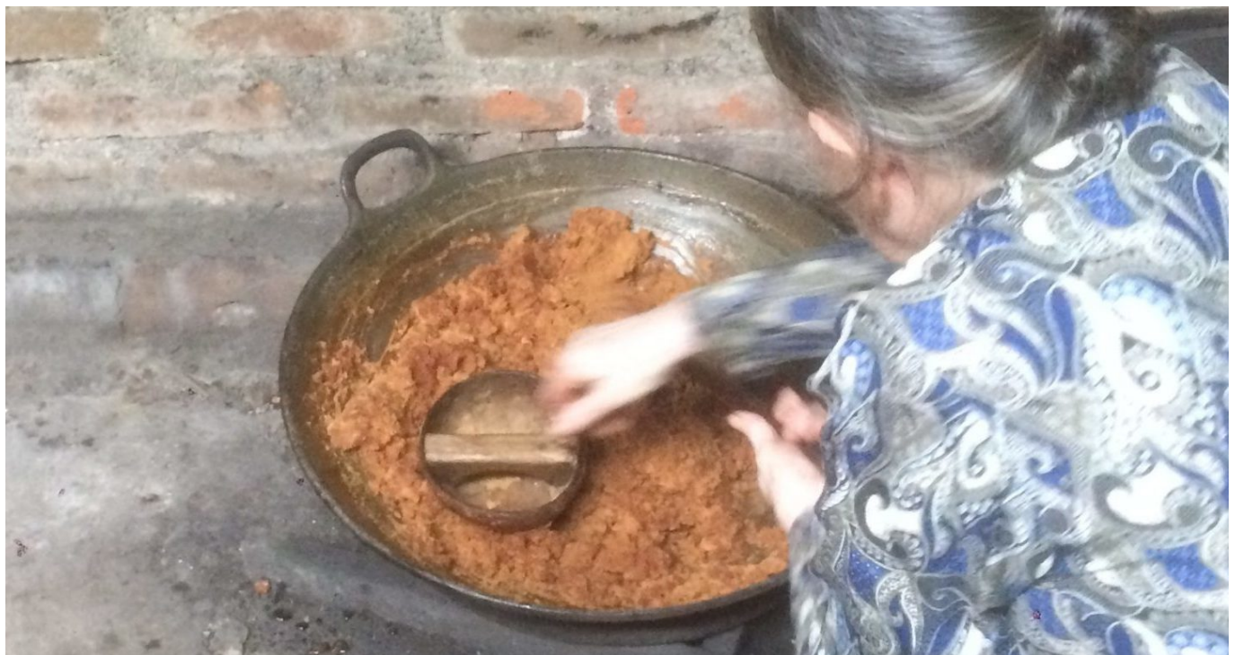
Herstellung von Kokosblütenzucker in Zentraljava

Bio-Kokosblüten-Zucker aus Indonesien versüsst auch hierzulande vielen Menschen Getränke und Speisen. Doch bei dessen Anbau, Vermarktung und Export zeigt sich, dass sich noch viel bewegen muss, wenn „Bio“ mehr sein soll als nur ein Fetisch von Verbraucher*innen.