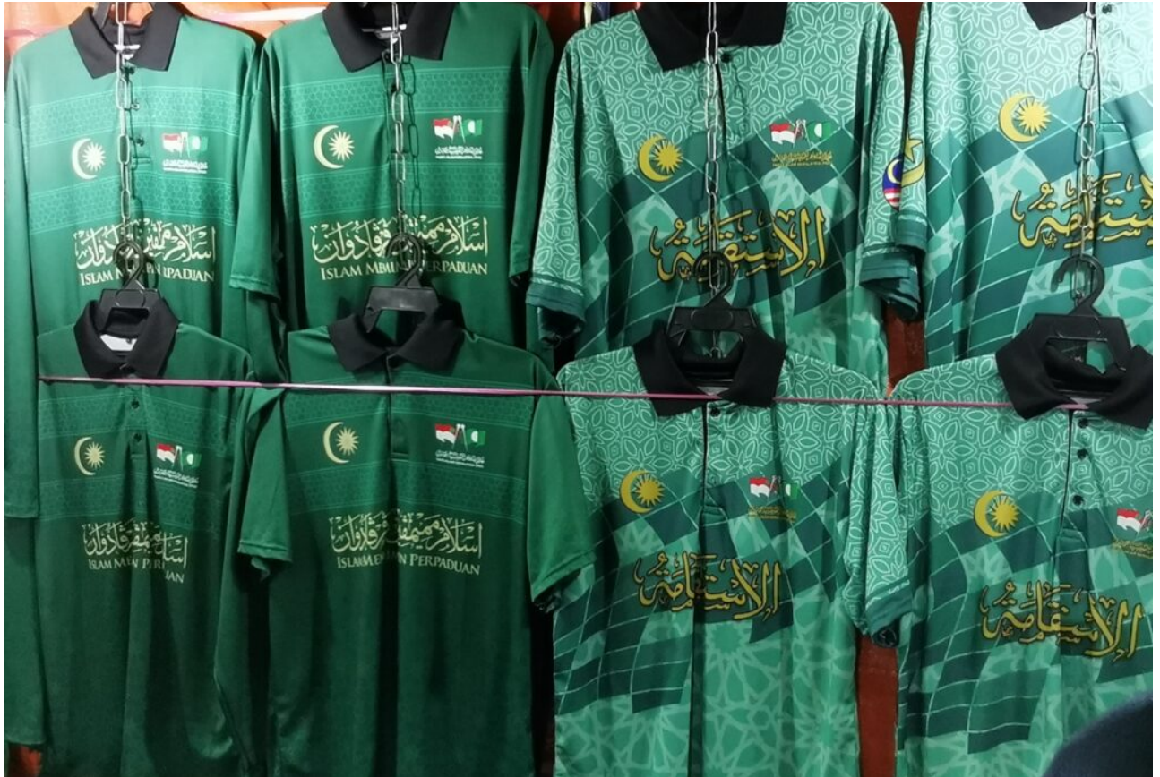
Malysias neue Konservative

Malaysia – Bei der Parlamentswahl im November 2022 erzielte die Malaysian Islamic Party (PAS) ihr bisher bestes Ergebnis. Das habe viel mit der Frustration der jüngeren Bevölkerung zu tun, sagt Politikwissenschaftler Kevin Zhang im Interview