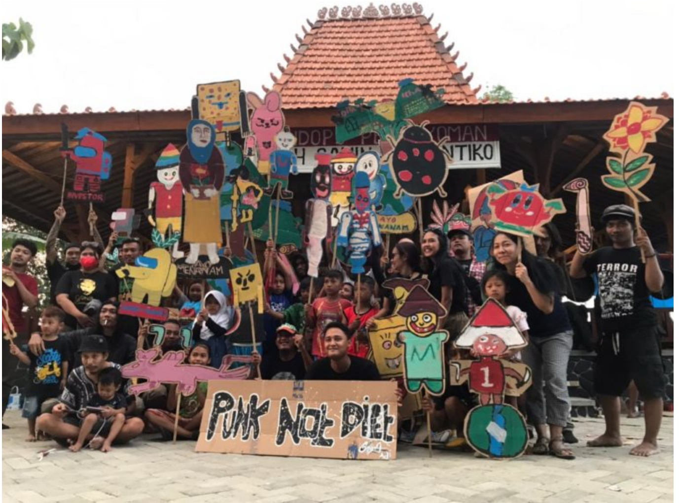
Zehn Künstler*innen und Kunstkollektive aus Südostasien gestalten die documenta fifteen mit. Tanja Gref stellt sie vor.