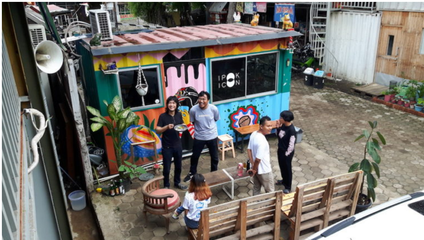
Die Journalistin Christina Schott stellt das kuratorische Konzept vor, mit dem das Kollektiv ruangrupa die documenta fifteen gestaltet. Leitprinzip ist lumbung - der gemeinsam verwaltete indonesische Reisspeicher.