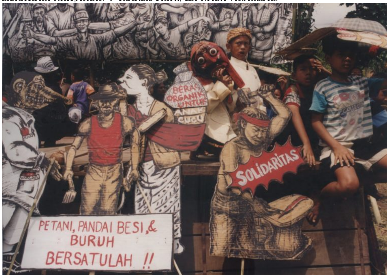
Die Wurzeln des gemeinschaftlichen Arbeitens in der indonesischen Kunst und wie sie sich im letzten Jahrhundert weiterentwickelt hat, analysiert die Kunsthistorikerin Claudia König.