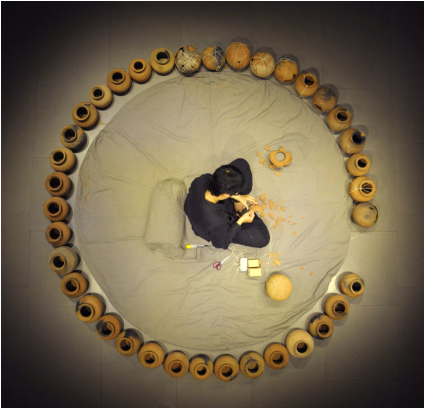
Full Circle performance at Meta House, 2012. © Amy Lee Sanford