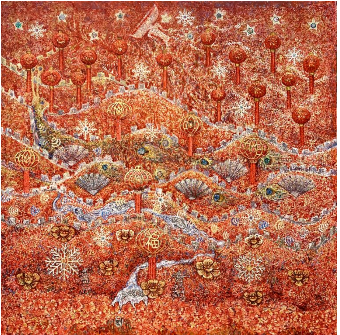
Der kambodschanische Künstler Leang Seckon gewährt im Interview Einblicke in sein Werk, mit dem er politische Strukturen sichtbar macht.