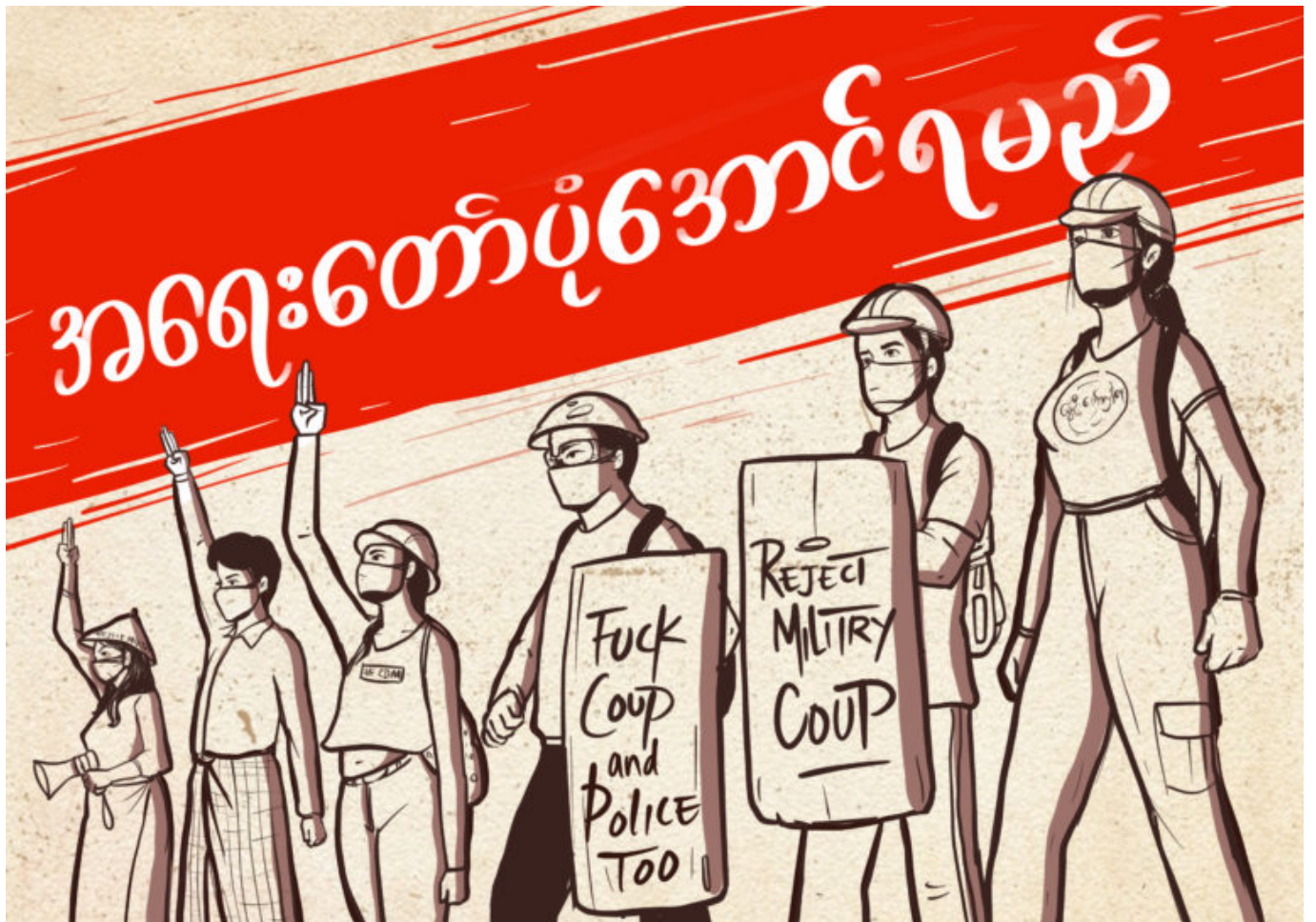
Die Poster der Künstlerin Ku Kue aus Burma/Myanmar begleiten die Proteste gegen das Militärregime. In einer Foto- Story stellen wir sie vor. © Ku Kue