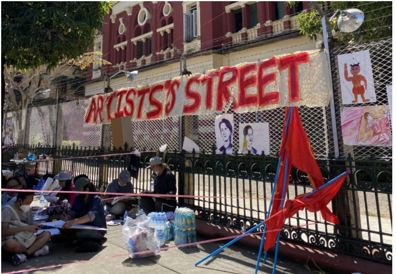
Auch in Myanmar spielen Künstler*innen eine starke, solidarische Rolle für die Gesellschaft, wie Natalie Johnston in ihrem Artikel berichtet.