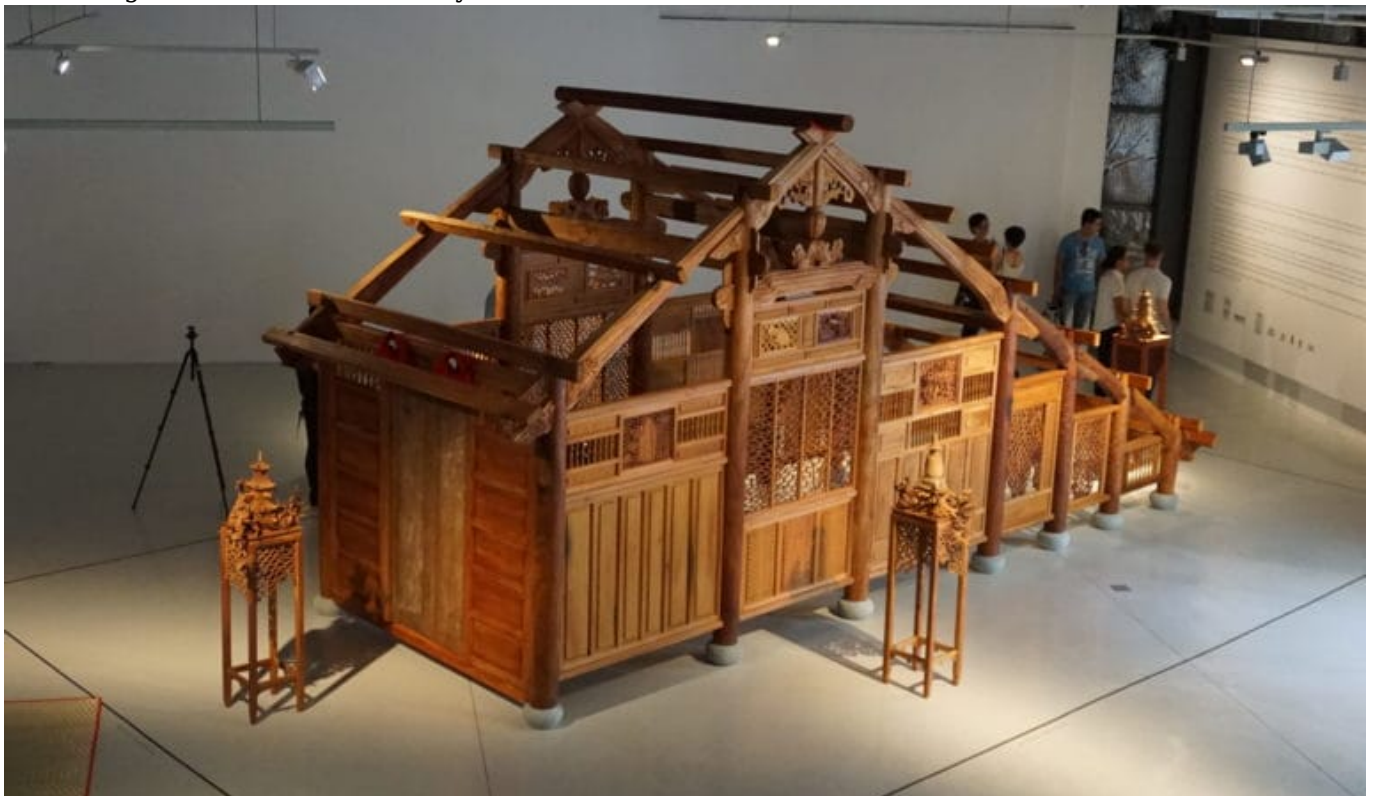
Auf Förderung vom Staat können Künstler*innen in Vietnam nicht bauen. Kuratorin Bùi Kim Đĩnh berichtet, wie dennoch Räume für zeitgenössische Kunst entstehen.