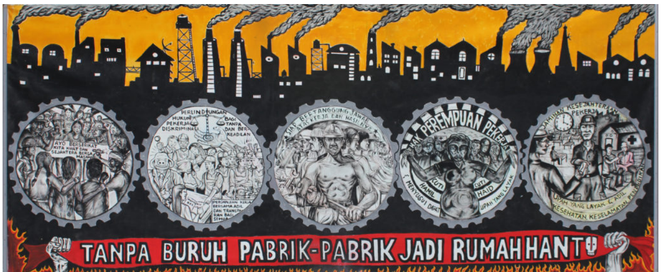
Solidarität mit künstlerischen Mitteln

Indonesien – Seit mehr als 20 Jahren streitet das Künstlerkollektiv Taring Padi mit kreativen Mitteln für die Rechte der Arbeiter*innen. Die Poster, Banner und Murals der Gruppe sind