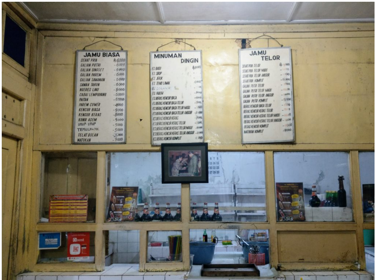
Jamu - mehr als ‚nur‘ traditionelle Medizin

In Indonesien gehört die Alternativmedizin Jamu zum Alltag. Jamu wird aus Pflanzen hergestellt und hat eine jahrhundertealte Tradition. An seiner Beliebtheit hat auch die Verbreitung der Schulmedizin nichts geändert.