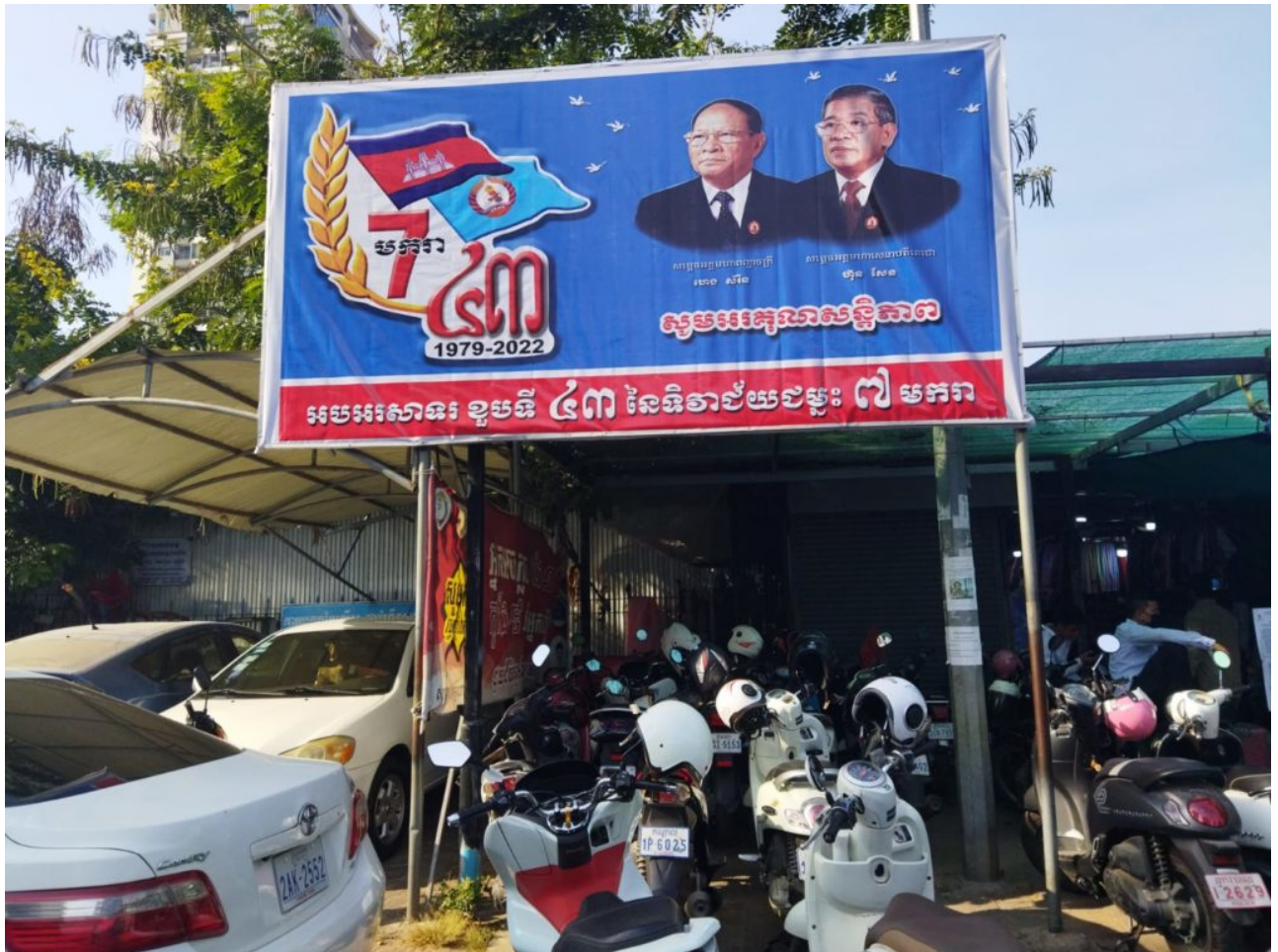
Repressionen zur Durchsetzung von Staatlichkeit

Südostasien - Die Übernahme der europäischen Idee des Staates führt in den Ländern des südostasiatischen Festlandes zu Gewalt der Herrscher gegenüber ihren Bürgern. Im Interview erläutert der Südostasienwissenschaftler Boike Rehbein die historischen Hintergründe.